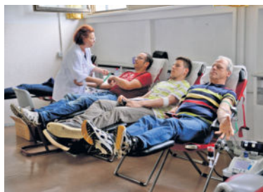
Seit vielen Jahren ist die Arnsdorfer Plattenbauschule ein beliebter Anlaufpunkt für die Blutspende. Durch die liebevolle Organisation des DRK-Ortsverband wird die Aktion zum Treff, mit Plausch und der Spende für den guten Zweck.

Mit einer Blutspende starten Sie als Lebensretter ins neue Jahr. Denn aus dem halben Liter einer Vollblutspende werden drei Präparate gewonnen, die für viele Patienten überlebenswichtig sind. Für den Spender selbst bedeutet die Blutspende eine Vorsorge für die eigene Gesundheit. Nur ein Beispiel: Vor jeder Blutspende wird unter anderem der Hämoglobinwert des potentiellen Spenders bestimmt. Das Hämoglobin ist ein Protein der roten Blutkörperchen (Erythrozyten). Da es dem Blut seine rote Farbe verleiht, wird es auch als roter Blutfarbstoff bezeichnet. Die wichtigste Aufgabe des Hämoglobins ist die Versorgung der Körperzellen mit lebenswichtigem Sauerstoff. Um eine Blutspende leisten zu können, muss der von der Spende gemessene Hämoglobinwert bei Männern > 13,5 g/dl (Gramm pro Deziliter) sein, bei Frauen > 12,5 g/dl.