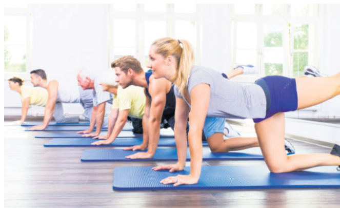
txn. Ausreichend Bewegung ist gesund und macht fit.