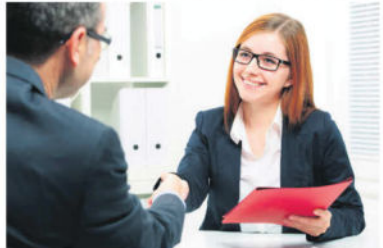
txn. Wer Karriere machen will, muss nicht zwangweise den Weg über die Universität nehmen. Auch eine Ausbildung bietet ausgezeichnete Perspektiven.

txn. Seit Jahren drängen Schüler an die Hochschulen, immer weniger junge Leute entscheiden sich für einen Ausbildungsberuf. Es herrscht die Ansicht: Wer studiert, macht Karriere und verdient viel. Das gilt jedoch nur, wenn das Einkommen über das ganze Arbeitsleben hinweg betrachtet wird; Akademiker überholen im Schnitt erst mit 31 Jahren die ehemaligen Lehrlinge, in manchen Branchen dauert es sogar noch länger. Das ist das Ergebnis einer aktuellen Studie der Vergütungs-