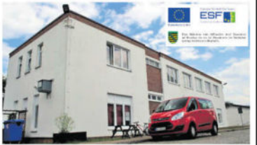
Tender Projekt in der Heidestr. 70/ Geb. 303 in Radeberg

Freie Stellen im Jugendberufshilfeprojekt Tender 2019 beim Stellwerk e.V. Freie Plätze im Projekt - jetzt bewerben!