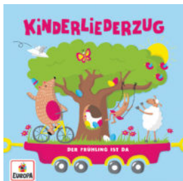
Kinderliederzug: Der Frühling ist da - Tschu, tschu, hier kommt der Kinderliederzug!