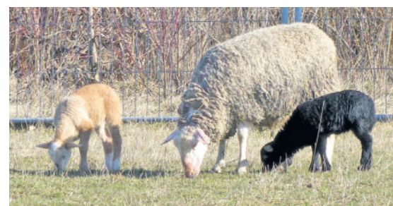
Nachwuchs 2019 „das schwarze Schaf der Familie“