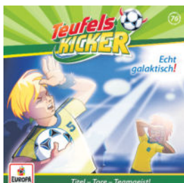
Teufelskicker - Echt galaktisch! (Folge 76)