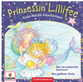
Gute-Nacht-Geschichten mit Prinzessin Lillifee - Die verzauberten Seerosen / Die goldene Perle