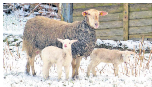
Mama Schaf mit ihren beiden Lämmern im vergangenen Frühjahr.

Doch steht es so lieb bei Mama, es hat wohl keinen Schabernack im Sinn. Bereits im vergangenen Jahr hatte Herr Römer uns ein Bild mit Mutter Schaf und ebenfalls zwei kleinen Lämmchen im Schnee geschickt, nun sind es wieder zwei Kinderchen geworden.