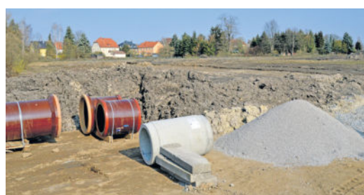
Auf dem großzügigen Areal entsteht neben 22 Baufeldern auch eine neue Zufahrtsstraße.

2018 kam dann erste Bewegung auf das Brachland. Vorbereitungen wurden getroffen, wie beispielsweise die Herrichtung einer Fläche zum Schutz, zur Pflege und zur Entwicklung von Natur und Landschaft. Mit dem Anlegen von Gebüschen sowie Reptilien- und Amphibienhabitaten wird auch den Interessen des Naturschutzes Folge geleistet. Nun arbeiten die fleißigen Bauleute bereits an der Erschließungsstraße und dem Anlegen der Medien.