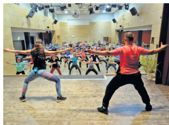
Blick von der Bühne des Bürgerhauses.