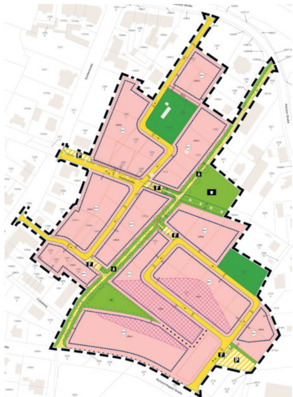
Die Planzeichnung zeigt die Einteilung des Areals. (PB Schubert)

Gemeinsam mit der Stadt Radeberg schloss die Kommunale Wohnungsbaugesellschaft mbH einen städtebaulichen Vertrag ab, um das Gebiet zu erschließen. Neben einigen alten Gärten lag das großzügige Areal bis dato brach. Zukünftig sollen Häuser verschiedener Art modernen Wohnraum bieten, der im Speckgürtel Dresdens bekanntlich dringend benötigt wird. Zudem erfährt die Radeberger Südvorstadt damit wieder einen Zugewinn. Bereits zu DDR-Zeiten sollten neben den Wohnblöcken an der Richard-Wagner-Straße / Schwabacher Allee auch auf der gegenüberliegenden Seite Wohnungen im typischen „Oststil“ entstehen, doch daraus wurde aufgrund des Materialmangels und der schließlich eintretenden politischen Wende nichts mehr.