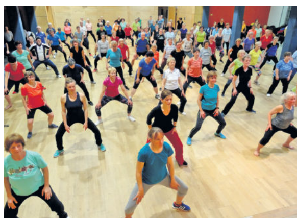
Aus Langebrück und der Umgebung kamen sie alle.

Turnverein Langebrück zieht positives Fazit / Seit 2017 gibt es das Event im Ort