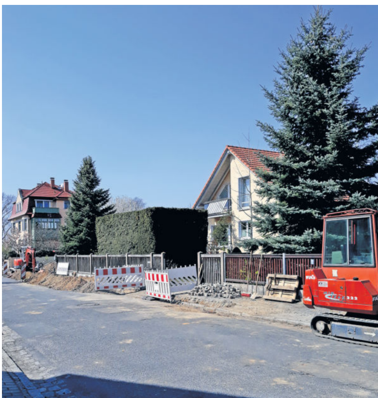
In der Badstraße wird seit Anfang April gebaut.

In der Zeit vom 29. April bis zum 11. Mai wird auf der Jakob-Weinheimer-Straße planmäßig der Teil zwischen Höntzsch- und Nicodestraße instand gesetzt. In der Zeit vom 27. Mai bis zum 8. Juni folgt der Abschnitt zwischen Nicodestraße und Dresdener Straße. Eine Verzögerung des Bauablaufs ist zurzeit nicht abzusehen. Bereits in der Januarsitzung des Ortschaftsrates