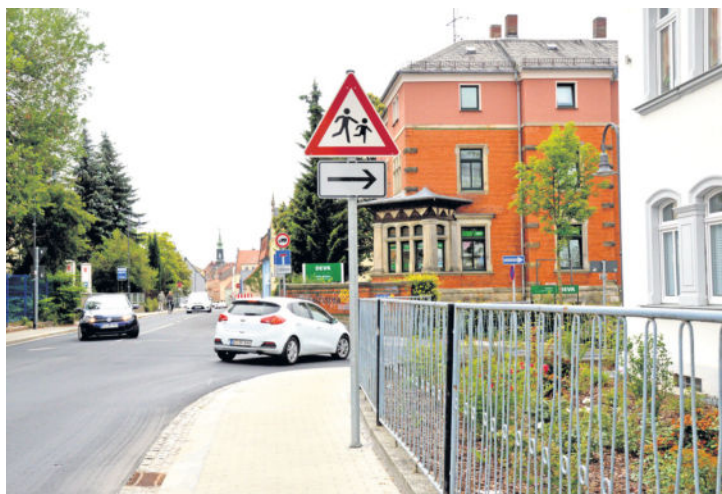
An der Kreuzung Badstraße / Otto-Bauer-Straße helfen selbst Warnschild und Asphaltmarkierung nicht, die Autofahrer auf den Vorrang der Fußgänger aufmerksam zu machen.

Als negativ werden die Erreichbarkeit des Stadtzentrums und das nicht gewährleistete, zügige Radfahren entgegengesetzt. Fahrradfahren in Radeberg macht also recht wenig Spaß und wird eher als Stress wahrgenommen. Die Radfahrer sind sich einig, nicht als vollwertige Verkehrsteilnehmer anerkannt zu werden. Und auch in Sachen Familienfreundlichkeit schneidet das Radeln in Radeberg sehr schlecht ab. Nur die wenigsten fühlen sich sicher, mit Kindern Rad zu fahren, diese selbst fahren zu lassen oder ein Fahrradanhänger zu nutzen. Besonders sicher fühlt man sich auf dem Draht-