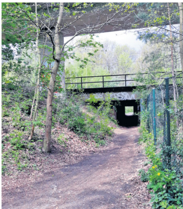
Nach Willen der Deutschen Bahn soll der Heidetunnel zugeschüttet werden.

Ulrike Caspary begrüßt die Entscheidung: „Ich freue mich, zu sehen, dass das Engagement so vieler Menschen für den Heidetunnel Klotzsche Wirkung zeigt. Wir haben als Fraktion Alternativen vorgeschlagen, wie die Unterführung an der Langebrücker Straße sicherer gestaltet werden kann, sollte der Erhalt des Fußgängertunnels tatsächlich nicht möglich sein. Eine Möglichkeit ist zum Beispiel die Verbreiterung der Unterführung, eine andere Variante wäre es den Kfz-Verkehr auf einer Spur zu führen mit einer wechselnden Ampelschaltung, oder aber der Neubau eines Fußgängertunnels an anderer Stelle.“ Eine sichere Lösung ist dadurch möglich, denn alle aufgezeigten Varianten werden nun geprüft. Wann mit einer Entscheidung zu rechnen ist, ist derzeit noch vollkommen offen. red/syg