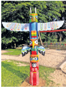
Das Team vom AWO-Kinderhaus-Wachau

Danach ging's ans aufräumen und in ein gespanntes Wochenende. Danke, liebe „Bienchen-Eltern“, es war eine top organisierte Indianerparty mit unvergesslichen Erlebnissen für Kinder und Erzieherinnen. Herr Kneipp würde von oben rufen: „Ja, ja, die Lebensordnung im Kinderhaus war eine Punktlandung am 14.06.2019!“