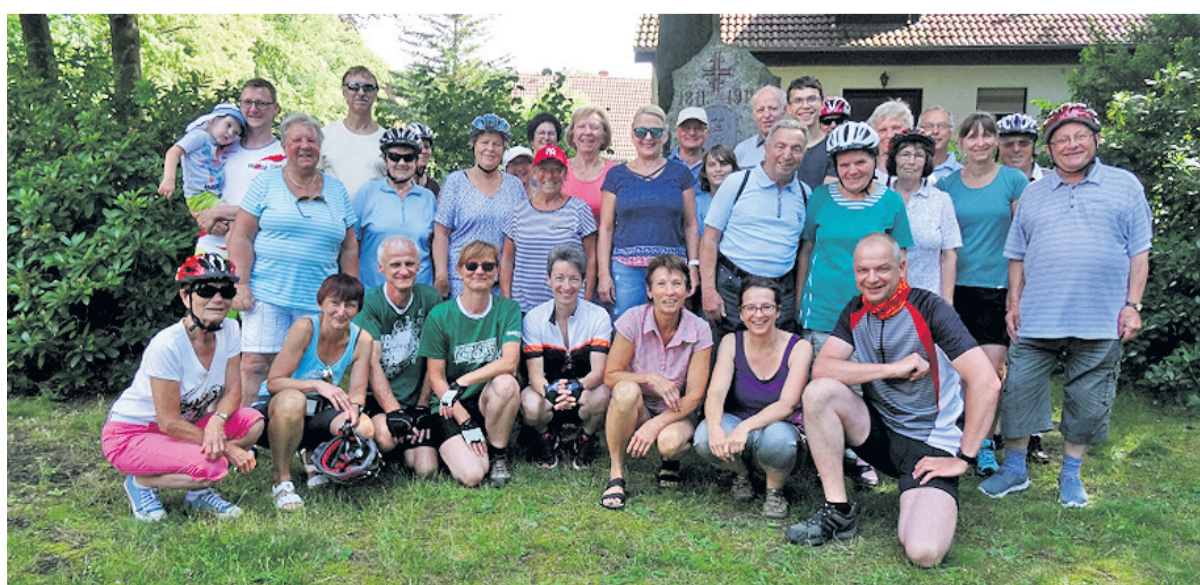
Bei der 26. Auflage gingen 33 Teilnehmer an den Start. Zwei Strecken waren im Angebot.