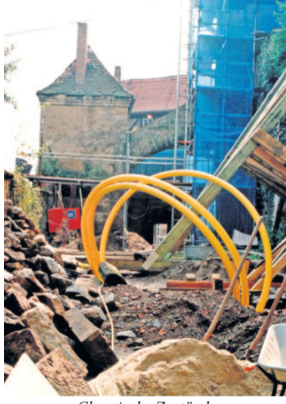
Chaotische Zustände im Unteren Schlosshof.

begann, wie bereits 1990 ein Kuratorium durch den amtierenden Museumsleiter R. Limpach, Stadtarchitekten Dr. P. Lunze, D. Rentsch und H. Müller gegründet wurde, wie viele durchaus mutige, teilweise wagemutige Entscheidungen über viele Jahre hinaus von Bürgermeister, Oberbürgermeister und den Stadträten getroffen werden mussten, als sie sich für die Übernahme des Schlosses durch die Stadt Radeberg aussprachen, welches bisher unter staatlicher Obhut gestanden hatte, so erfüllt das durch-