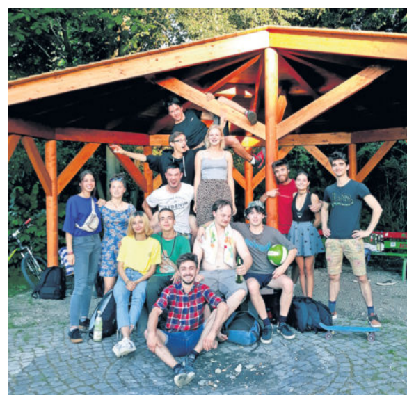
Das Ergebnis kann sich sehen lassen. Der Gruppe gefällt der neue Freizeittreff am Bürgerhaus.

Zwei Jahre von der Idee bis zur Umsetzung: An der Festwiese am Bürgerhaus wurde für die Sitzecke ein Wetterschutz gebaut. Die Idee wurde im Jahr 2017 seitens der Mobilen Jugendarbeit Dresden-Nord geboren, da sich der Jugendklub im alten Gaswerk immer weniger eignete. Unterstützung gab es durch den Stadtjugendring. Ein Antrag auf Förderung wurde im vergangenen Jahr gestellt. Im Frühjahr 2018 kam der Vorschlag von einer Eigeninitiative interessierter Jugendlicher, selbst aktiv zu werden. Die Ortschaft sollte lediglich das Material stellen. Das scheiterte an der juristischen Hürde, da sich die Sitzecke im öffentlichen Raum befindet. Nunmehr stellte die Ortschaft 5.000 Euro aus den Verfügungsmitteln bereit. Die Stadt Dresden gab weitere 6.000 Euro. Das Amt für Stadtgrün und Abfallwirtschaft übernahm Planung, Sicherstellung und Ausführung. Das Ergebnis ist seit Anfang Juni zu sehen und wird von den Jugendlichen als Freizeittreff sehr gut angenommen. geb