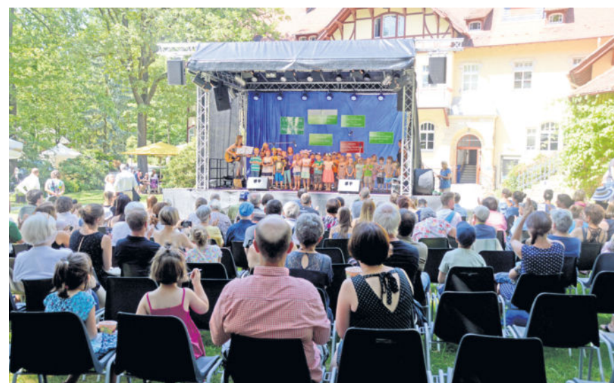
Das bunte Bühnenprogramm wurde am Nachmittag von den Kita-Kindern aus Liegau eröffnet.

Auf dem Gelände des Epilepsiezentrums Kleinwachau fand am vergangenen Samstag das große Dorf- und Sommerfest statt. Platz genug für reichlich Attraktionen, Mitmach-Aktionen und Erlebbares gab es zwischen den großen Bäumen des historischen Geländes auf jeden Fall. So störten auch die heißen Sommertemperaturen nicht all zu sehr. Man konnte gemütlich schlendern, einiges entdecken und dem Programm auf der Bühne bei kalten Getränken und leckerem Essen folgen. Am Abend rockten dann „The AIRMateurs“ sowie „Die Rockys“. Mit dem gemeinsamen Fest von „Epi“ und den Liegauern feierte man 130 Jahre Kleinwachau, 300 Jahre Augustusbad und 800 Jahre Radeberg.