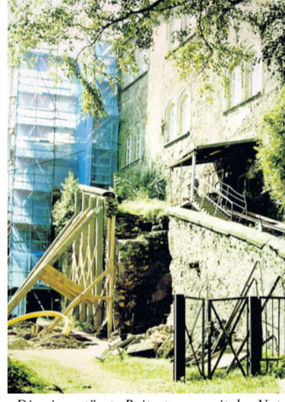
Die eingestürzte Reitertreppe mit der Not-Sicherung und dem ehem. Kohlen-Aufzug.