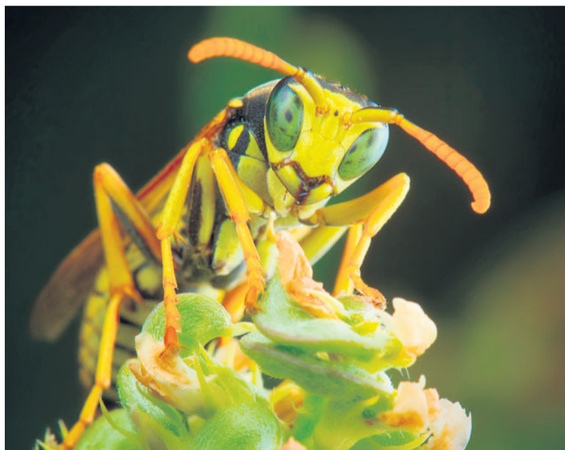
Achtung Wespe: Die Insekten bauen ihr Nest vorzugsweise an dunklen und geschützten Orten.

Wespennester sind etwas für den Fachmann - Laien bleiben lieber fern. Denn bereits kleinste Erschütterungen machen die Tiere aggressiv. Außerdem gut zu wissen: Wespen stehen unter Naturschutz. Ohne die Zustimmung der zuständigen Behörde ist das Entfernen ihrer Nester