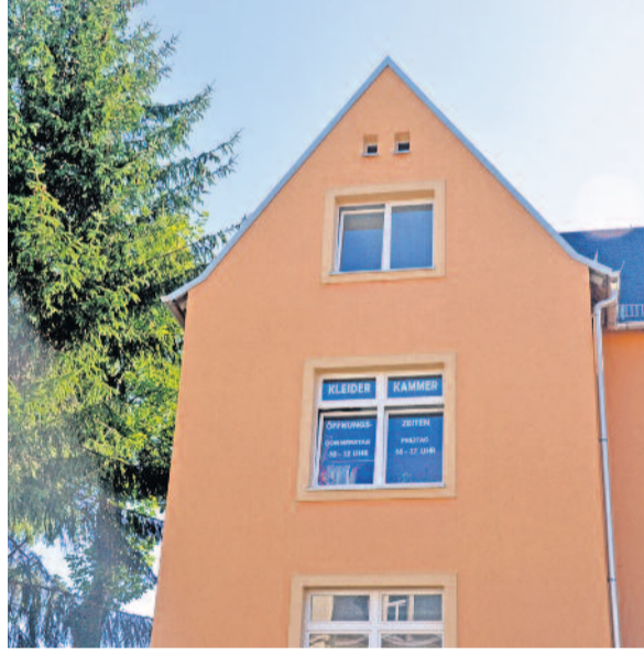
Sichtbar: Seit Kurzem zeigt sich die Kleiderkammer mit Schriftzug in den Fenstern.

rige Waren wie Gläser, Geschirr und Schreibwarenbedarf - alles Artikel, die nicht mehr mit in das Zweitgeschäft nach Dresden-Weißig umgezogen sind. Denn Kunden des Geschäftes finden das Angebot weiterhin im Hochlandcenter Dresden-Weißig.