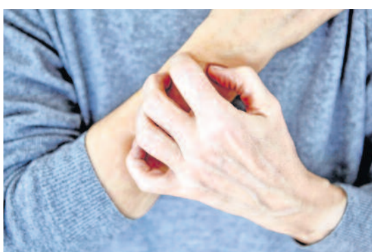
Jucken führt zu Jucken - daher ist es wichtig, aus dem Teufelskreis auszubrechen und nicht zu kratzen.

(djd). Früher noch mit unkomplizierter Haut gesegnet, klagen mit den Jahren immer mehr Senioren über anhaltenden Juckreiz - etwa 50 Prozent der über 70-Jährigen sind davon betroffen. Der Grund: Im Lauf des natürlichen Alterungsprozesses kommt es zu charakteristischen Hautveränderungen. So nimmt mit der Zeit der Lipidgehalt der Haut ab. Das Bindegewebe verliert nach und nach seine Wasserbindungsfähigkeit, die Spannkraft der Haut sinkt. Auch vermindert sich die Aktivität der Schweiß- und Talgdrüsen. Die Konsequenz: Feuchtigkeit und Fettstoffe fehlen. Hinzu kommt, dass ältere Menschen dazu neigen, zu wenig zu trinken. Reife Haut erscheint daher häufig trocken und rau, vor allem an Partien, die ohnehin wenig Talgdrüsen aufweisen. Dazu gehören die Hände, die Oberarme, Knie und Schienbeine, der Hals oder auch das Dekolleté.