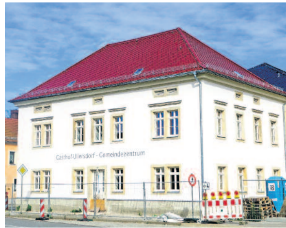
Text: Red.

Passierte man die Baustelle des Gasthofes in Ullersdorf noch vor ein paar Wochen, versteckte sich die Fassade des Bauwerkes noch hinter einem Gerüst mit Sicherungsnetzen. Mittlerweile ist die strahlende Außenansicht jedoch ein richtiger Hingucker, denn das Gerüst ist seit einiger Zeit endlich verschwunden. In großen Buchstaben steht nun am Gebäude „Gasthof Ullersdorf – Gemeindezentrum“. Die Ortsmitte ist also wieder ein Stück attraktiver. Mit neuer Turnhalle und dem nun umgesetzten Projekt Gasthof verfügt auch der Radeberger Ortsteil am Rande Dresdens bald über einen modernen Treffpunkt für Bürger, Vereine und Institutionen. Allerdings gibt es noch einiges zu tun und ein Fertigstellungstermin steht noch nicht fest, wie wir auf Nachfrage von der Stadtverwaltung erfahren. So ist der Innenausbau noch in vollem Gange. Auch der prägnante Vorbau an der Eingangstür fehlt noch und so sind die Bauleute sicherlich noch einige Zeit beschäftigt. Doch zumindest strahlt der ehemalige Gasthof nun in einem hellen Farbton und nicht mehr in tristem Grau.