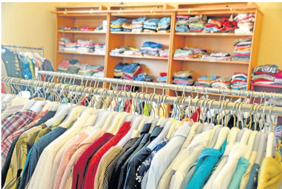
Geordnet: Dank der Spenden konnten die Regale teilweise ausgetauscht werden, um Kleider, Schuhe, Spielzeug usw. besser präsentieren zu können.

Sie ist ein offener Treffpunkt, eine Anlaufstelle für „Neu-Radeberger“ wie beispielsweise Asylsuchende, aber auch ein Raum für Jung und Alt. Hier kann man für den sogenannten „schmalen Taler“ Kleidung, Schuhe, Haushaltswaren, Spielsachen und einiges mehr erwerben. Egal ob man gern nach Second-Hand-Ware schaut, jeden Euro zweimal umdrehen muss oder etwas ganz Spezielles sucht, in der Kleiderkammer des Bündnis Radeberger Land e.V. trifft man auf nette, offene Menschen, die die gespendeten Sachen sortieren, ordnen und an den nächsten Besitzer ausgeben. Einen obligatorischen geringen Wert bezahlt man für die gewählten Sachen, denn der Verein finanziert so die laufenden Kosten des Projektes.