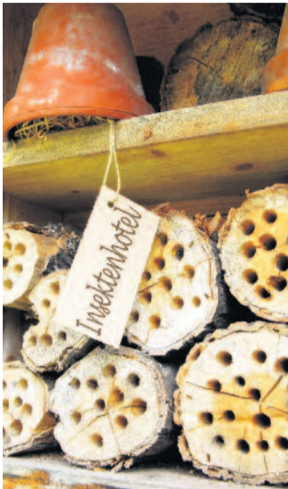
Beispiel eines Insektenhotels