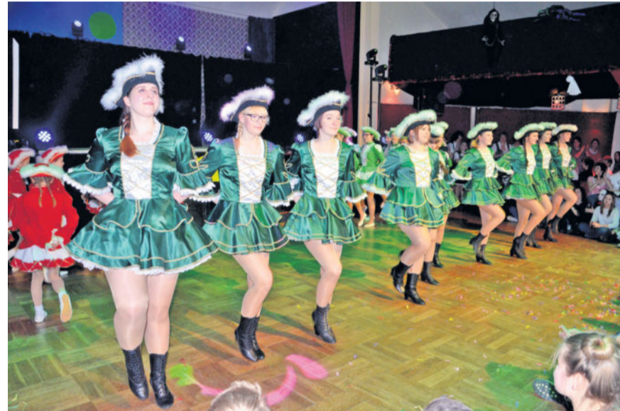
Fasching mit dem LCC (Lomnitzer Carnivalsclub) im großen Saal