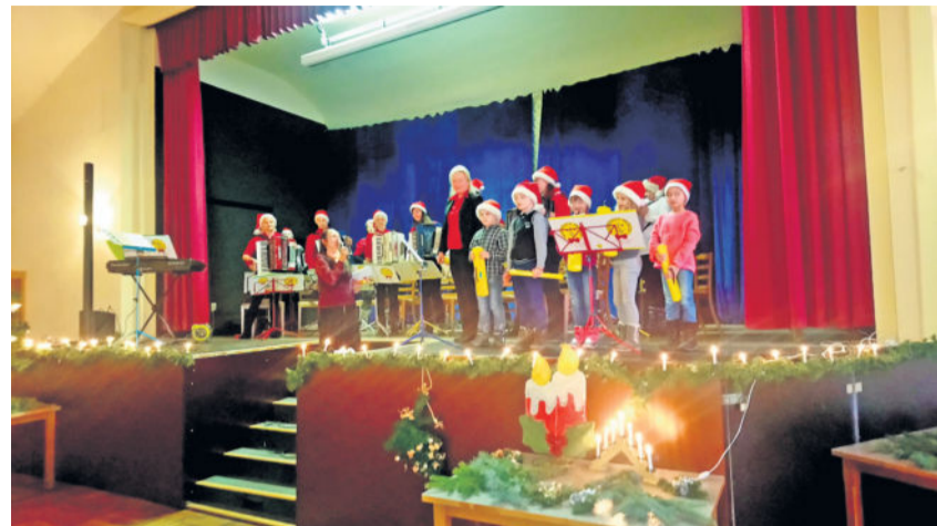
Weihnachtsfeier des Seniorenclubs Lomnitz am 17. Dezember 2017 mit der Musikschule Fröhlich.

„Bald nach dem Kriegsende 1945 wurde das Volksheim als kulturelles Zentrum des Ortes wiederbelebt. Schon 1945 fand die erste Kirmesse statt. Bereits in Jahre 1948 war ich bei den Reigenfahrern.“