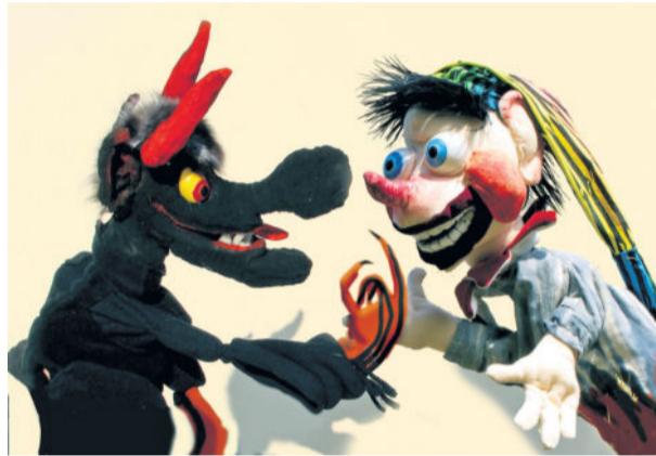
Kasper und des Wolfes schauriges Gehül

Wie schon so oft lädt der Schlossverein bei frühherbstlichem Wetter zum Puppenspiel auf Schloss Klippenstein nach Radeberg – und in dem von attraktiven Angeboten gespickten Kulturkalender der Röderstadt wird mit dem freitäglichen Abendangebot am 27.09. ein offensichtliches i-Tüpfelchen gesetzt: Im Rahmen einer Doppelveranstaltung zum Freitag-Abend werden nach leichter Kost eines frechen Kaspers (Lutz Männel aus Oppach eröffnet den Abend bereits 18.30 Uhr) die Gäste 19.30 Uhr zum Schlemmerbuffet gerufen, ehe 20.30 Uhr das beeindruckend skurrile Spektakel von „Königs Weltreise“ die Zuschauer in seinen Bann ziehen wird. Und es wird ein so noch nicht gezeigtes Spektakel toller Bilder die Besucher des Schlosses im Saal in den Bann ziehen. Die Darbietung des Theaters Handgemenge stellt in der hier gebotenen Art ein sehr spezielles Novum im Bereich des Puppenspiels dar. Marie Feldt und Peter Müller werden uns auf eine surreale und abenteuerliche Reise um die halbe Welt führen und mehr als sechzig Mitwirkende werden mit Hilfe extravaganter Figuren- und Lichttechnik im wahrsten Sinne des Wortes in den Schatten gestellt. Als Vorlage der Geschichte dienten Schattenbilder der bildenden Künstlerin Wiebke Steinmetz.