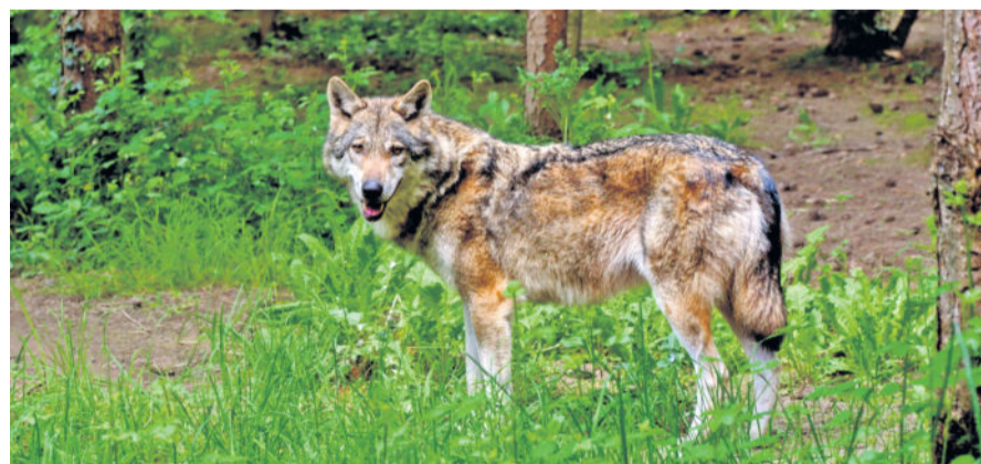
In der Dresdner Heide hat sich offenbar ein Wolfsrudel angesiedelt. Eine Wildkamera hatte im August vier Welpen aufgenommen. Auch bei den Heideanrainern ist die Wolfssichtung immer mal wieder Thema.