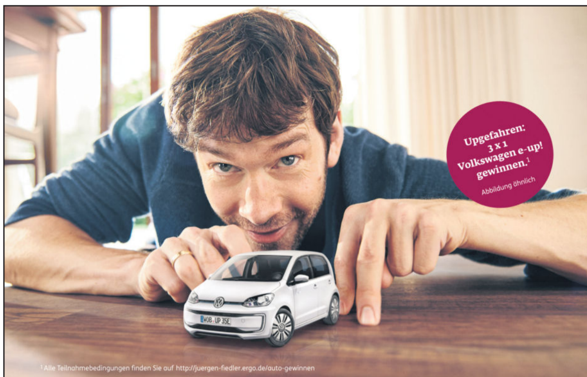
*Alle Teilnahmebedingungen finden Sie auf http://juergen-fiedler.ergo.de/auto-gewinnen