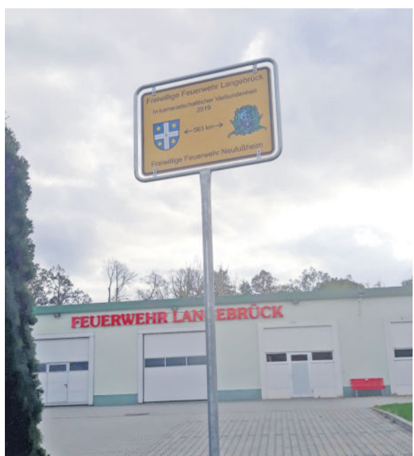
In der vergangenen Woche wurde dieses besondere Schild am Feuerwehrgerätehaus in der Lessingstraße angebracht. Erhalten haben es die Langebrücker am 31. Mai von der Feuerwehr Neulußheim.

Es ist vollbracht, die Mitglieder der Feuerwehr Langebrück haben jetzt ein besonderes Schild an ihrem Gerätehaus in der Lessingstraße aufgestellt. Zur Erinnerung: Allein vier Geschenke erhielten die Langebrücker aus der Partnergemeinde Neulußheim im Rahmen der 125-Jahrfeier der Feuerwehr am 31. Mai. 350 Euro gab es von der Gemeinde. Und von der Feuerwehr ein Fahnenband mit den Insignien beider Orte und Wehren, eine altherwürdige Kübelspritze, auf dessen Vorderseite ebenfalls die Partnerschaft verewigt wurde, und ein Ortseingangsschild mit der Aufschrift „Neulußheim 563 km“. Das ist auf der Rückseite zu lesen, auf der Vorderseite heißt es unter anderem: „Aus kameradschaftlicher Verbundenheit“. Und genau das Schild wurde jetzt angebracht. „Nochmal ein ganz großes Dankeschön, liebe Neulußheimer“, schreiben die Brandschützer dazu, zudem der Vermerk ein Symbol für Freundschaft, ist.