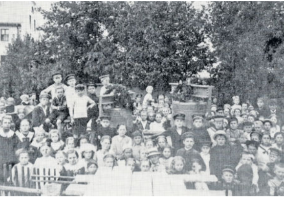
Hier wurden die Glocken in den neuen Glockenstuhl geschoben