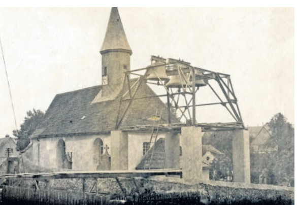
Der neue Glockenturm

Letzter Teil - Die beiden alten Kirchenglocken mussten am 29. Mai vom Kirchturm abgenommen und zum Einschmelzen abgeliefert werden. Am 5. September 1918 traten drei neue Gußstahlglocken in Arnsdorf ein. Erbgerichtspächter Bruno Häse hatte sie der Gemeinde gestiftet. Siehe auch „die Radeberger“ Nr. 38 vom 21.09.2018. Für die Glocken musste an der oberen Kirchhofsmauer ein neuer Glockenstuhl gebaut werden. Am 7. September wurde zur Probe geläutet und am 15. September, zum Erntedankfest, erfolgt die Weihe der Glocken. Endlich nach einem reichlichen Jahr, konnte in Arnsdorf wieder geläutet werden.