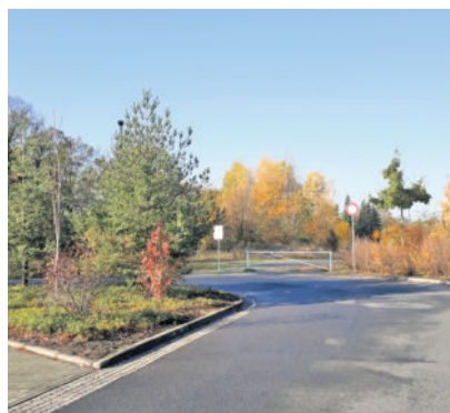
Der P+R-Parkplatz am Bahnhof soll im hinteren Bereich erweitert werden.

Sichtbar geht es mit dem Bau des Kinderzentrums in der Friedrich-Wolf-Straße voran. Laut Ortsvorsteher soll das Objekt ab Oktober 2020 genutzt werden können. Bekanntlich können in dem Haus dann Kindergarten- und Hortkinder betreut werden. Perspektivisch würden sogar Räume für die Grundschule zur Verfügung stehen, dann wäre sogar eine dreizügige Nutzung - also drei Klassen pro Stufe - möglich. Wie wichtig die Fertigstellung ist, deutete der Ortsvorsteher bereits an. Denn aktuell stehen zu wenig Kitaplätze zur Verfügung. „Es finden sich auch keine Tagesmütter mehr, auf die wir zurückgreifen können“, so Herr