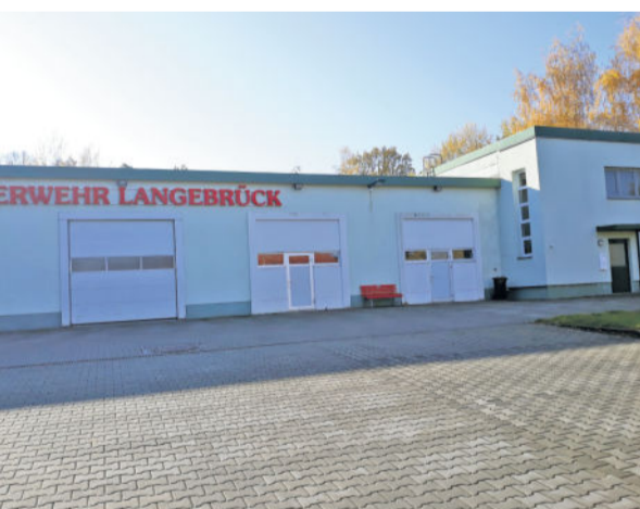
Das Gerätehaus der Feuerwehr ist zu klein. In den Jahren 2022 / 2023 soll ein Erweiterungsbau entstehen.