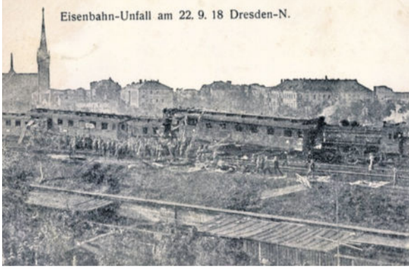
Eisenbahn-Unglück in Dresden