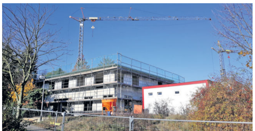
Im Oktober 2020 soll das Kinderbetreuungshaus fertig sein.