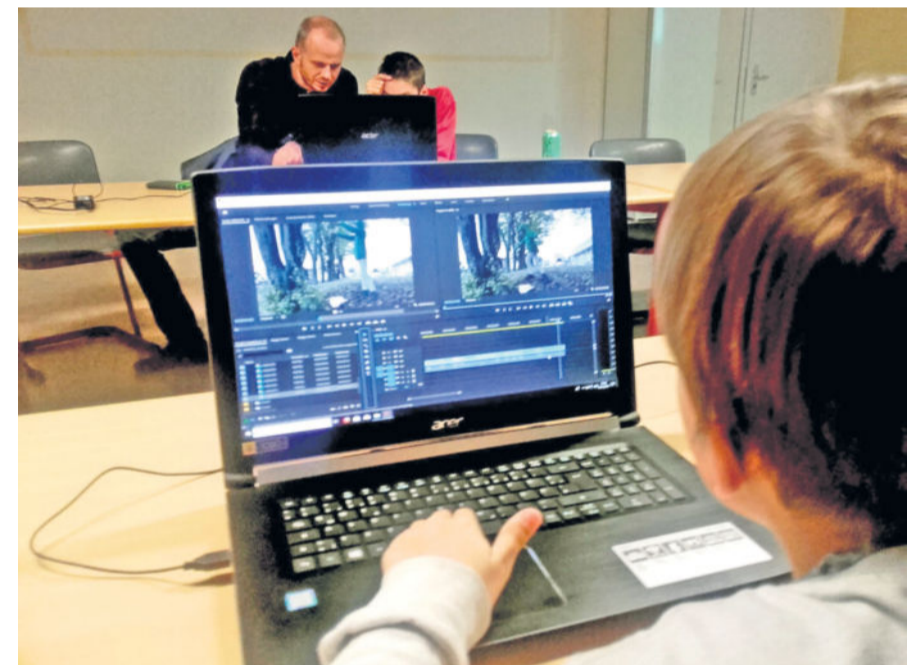
Kinokids beim Filmschnitt mit dem SAEK Dresden

Die Kinokids haben sich selbst im Filme machen ausprobiert und einen kurzen Trailer als Vorprogramm gedreht. Man darf also gespannt sein! Der Eintritt ist wie immer frei.