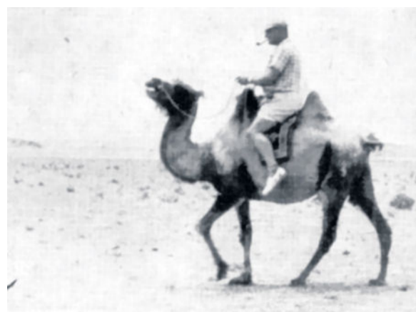
Muche in der Mongolei, 1964