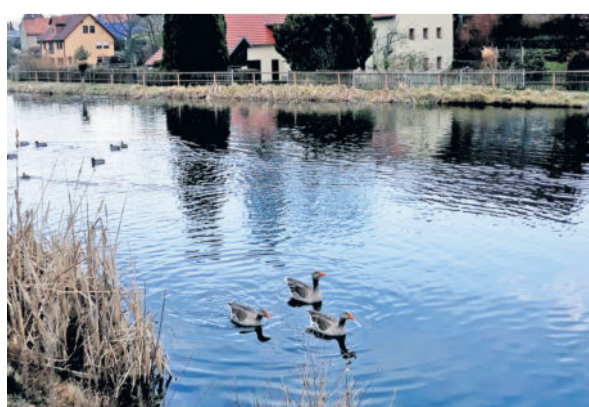
Auf dem Langebrücker Mühlteich fühlen sich die drei Graugänse sichtlich wohl.