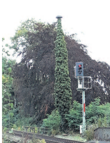
Blick vom Bahnsteig in Richtung Dresden auf die Kuriosität.