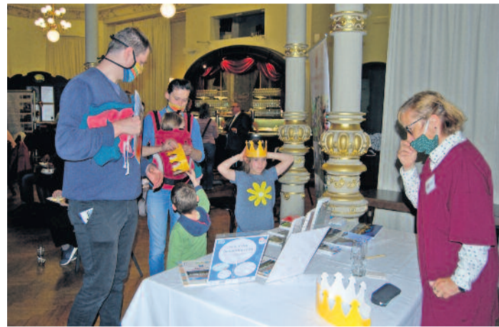
Zum Neubürgerempfang konnte man sich auch über das Schloss Klippenstein informieren.