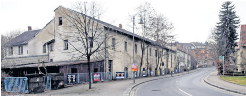
Die Industriebrache „Wellpappe“ vor dem Abriss.