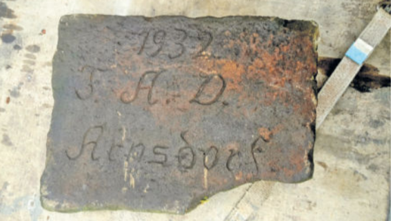
1932 Steinplatte gefunden an 3 Bahnbrücken Arnsdorfer Seite rechts