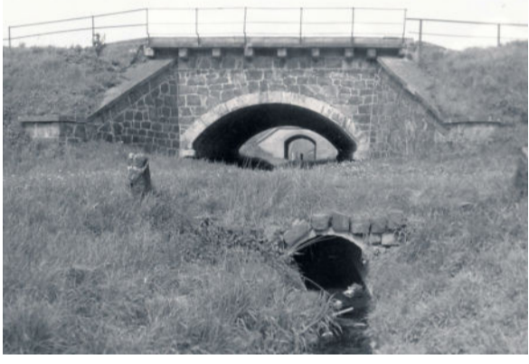
1984 an den 3 Brücken

Als erste Arbeiten übernahm man die Verpflegung, Vergrößerung