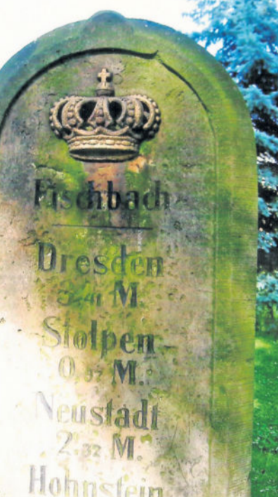
Die Postsäule aktuell.