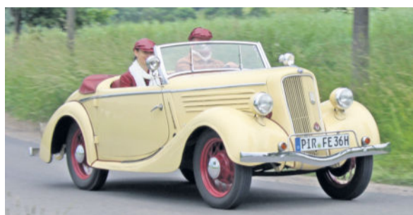
Gläser Cabriolet Ford Eifel, gefertigt 1935 bis 1940