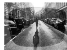
Mit ZEISS SkyPol®

Spätestens nach der Diskussion um schwindende Ozonschicht und Ozonloch ist ein guter UV-Schutz beim Sehen wichtig und das nicht nur im Sommer. UV Licht ist für uns Menschen wichtig, aber die Dosis macht das Gift. Wussten Sie, dass auch Augen einen Sonnenbrand bekommen können? Ein Übermaß dieser kurzwelligen Strahlung kann zu Entzündungen der Binde- und Hornhaut führen. Frühzeitiger Grauer Star und verschiedene Netzhauterkrankungen werden unter anderem auch auf ein Übermaß an UV Licht zurückgeführt.