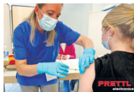
COVID-19 Impfkation bei Prettl Electronics in Radeberg

Prettl Electronics GmbH | Robert-Bosch-Straße 10 | 01454 Radeberg info@prettl-electronics.com | www.prettl-electronics.com