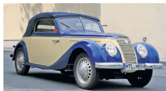
IFA F8 (basiert auf DKW F8), gefertigt 1947 bis 1955 im KWD, Zweigwerk Radeberg (ab 1953 IFA)