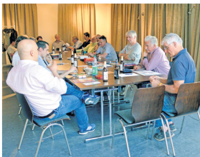
So wie hier im Jahr 2018 werden die Treffen durch die Hygienemaßnahmen nicht aussehen aber zumindest trifft sich der Münzsammlerstammtisch nun wieder.

u.v.a. in der Lebensrealität an und mit ihnen die vielen „wohlstandsgesättigten“ Wähler in den alten Bundesländern?