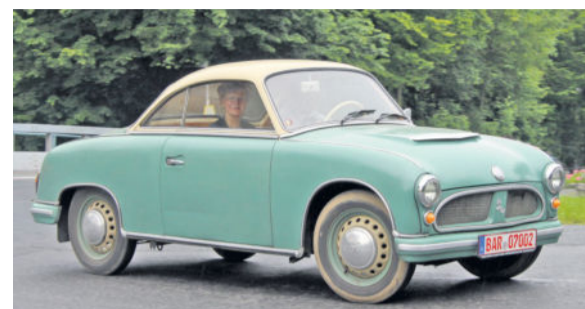
IFA P70 Coupé, gefertigt 1955 bis 1959 im KWD, Zweigwerk Radeberg (ab 1953 IFA)

kam es in den Betriebsteilen Dresden und Radeberg zur Demontage der Produktionseinrichtungen und deren Überführung in die Sowjetunion. Ausgelagert und mitgenommen wurden auch die wertvollen Firmenunterlagen und Baupläne.