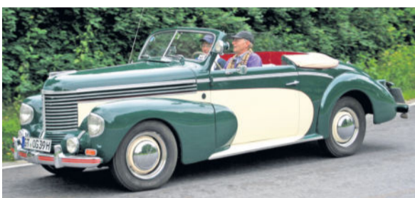
Gläser Cabriolet Opel Kapitän 1938

Mit Aufträgen der Auto-Union und ohne Schuldenlast der alten Firmen, denn die Betriebsanlagen wurden gepachtet, alle Warenvorräte gekauft und die Löhne der Arbeiter gekürzt, gelang der „Gläserkarosserie GmbH“ bereits ab 1933 der erfolgreiche Neubeginn. Es setzte in den nächsten Jahren ein erneuter regelrechter Boom der weiteren technischen und unternehmerischen Entwicklung ein, ganz im