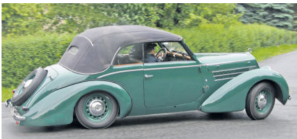
Gläser Cabriolet Steyr Typ 220