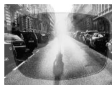
Mit heckökmlicher Sonnenbrille

den Zeiss Relaxed Vision Experten im Dresdner Norden und Pulsnitz Sonne, Bewegung und Sport in Zeiten der begrenzten Freiheit Sonnen- und UV Schutz bis 400 Nanometer Umfassender Schutz und Sonnenschutz fängt bei perfektem Sehen an