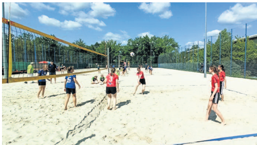
Das Spielbild zeigt das kleine Finale, in dem es um den 5. Platz ging, welches die LBSV-Mädels (rote Shirts) gewinnen konnten.

Auch gegen stärkere Gegner zeigten die U16-Mädels des LBSV eine gute Leistung / Jugend-Trainerin Fanny Haase zieht ein positives Fazit