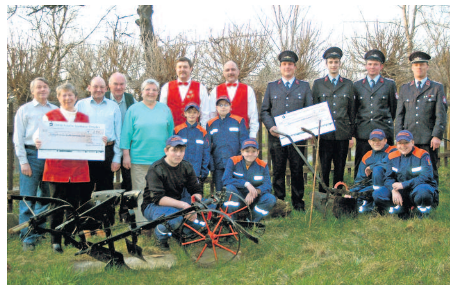
Spendenübergabe im Jahr 2007: Die Heimatstube und die Jugendfeuerwehr erhalten jeweils 250 Euro vom Karnevalsclub Großerkmannsdorf.