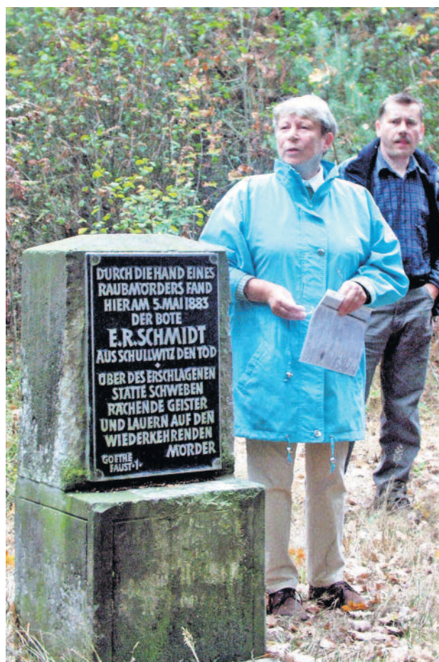
Führung durch den Karswald zum Tag des offenen Denkmals im Jahr 2003.