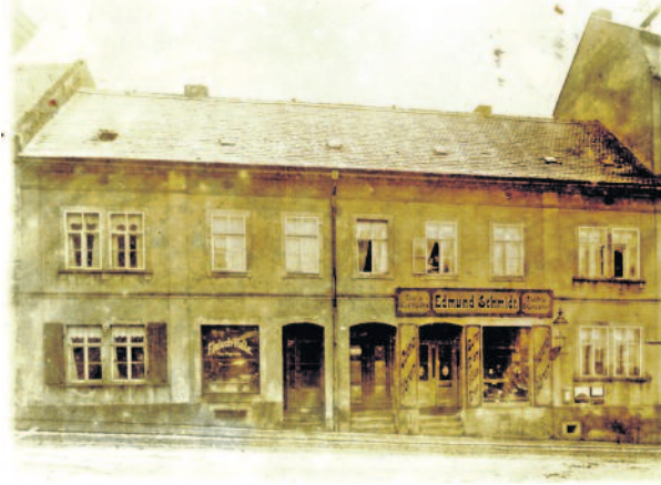
Das Geschäft etwa um 1918.