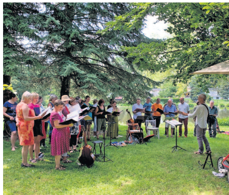
Das Benefizkonzert der Liegauer Liederlust am Forellenteich.

borgen werden kann. Wir sind in intensiven Gesprächen mit dem Forst und der Naturschutzbehörde des Landkreises, um festzulegen, was jetzt getan werden muss.“