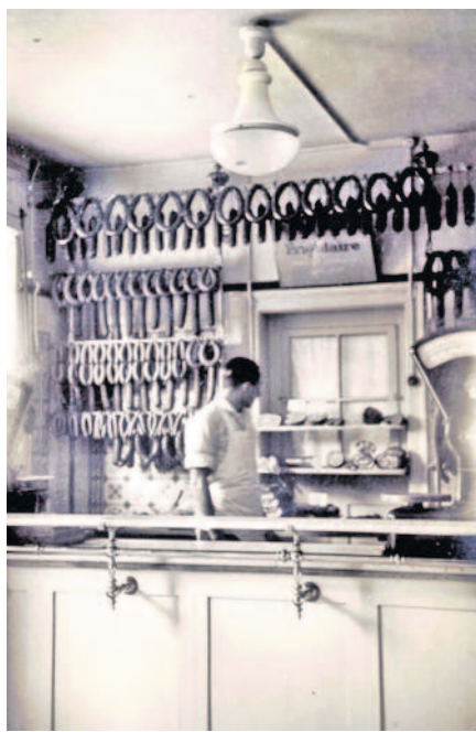
Der Laden noch mit Gasbeleuchtung.

Sobald es wieder etwas zu Schlachten gab, wurde das Geschäft wieder eröffnet. Die älteren Leser und Leserinnen kennen noch die Lebensmittelkarten. Bis 1958 waren Fleisch- und Wurstwaren rationiert. Die Verkäuferinnen mussten möglichst grammgenau die vom Kunden gewünschte Menge abschneiden, dann wurden von der Lebensmittelkarte die entsprechen-den Marken zu 50g, 100g, oder 200g abgeschnitten. Der Fleischer sammelte diese und am Monatsende wurden damit A4 Bogen beklebt, um die geforderte Abrechnung im Rathaus übersichtlich zu ermöglichen. Das war für die Berechnung des Kontingents notwendig. Wenn man z.B. 200 kg Ware bezog und nur 170 kg Marken abgerechnet wurden, musste der Fleischermeister einen Warenbestand von 30 kg vorweisen. Das wurde streng kontrolliert und bei Fehlmenge gab es harte Strafen, denn der Fleischer hatte offensichtlich Ware schwarz verkauft. Dass Fleisch und Wurst bei der Produktion deutlich an Gewicht verliert, wollten die staatlichen Kontrolleure nicht wissen. Alle selbständigen Handwerker galten ja damals ohnehin als Kapitalisten.