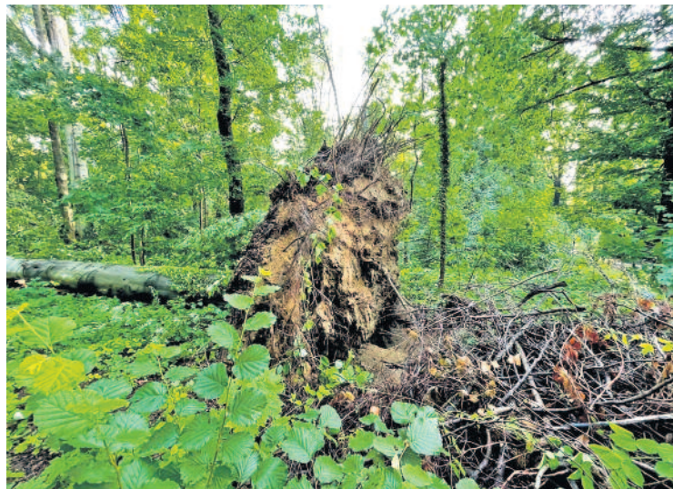
Die durch den Sturm entwurzelte Buche

Ein heftiges Gewitter hat im Forellenteich am Dienstag, dem 13.07.2021 großen Schaden angerichtet. Während des Durchzugs der Gewitterfront, kurz nach 22.00 Uhr, kam es zu lokalen Böen in Orkanstärke, die nur wenige Minuten andauerten. Die Krone einer Linde brach ab, mehrere Großbäume wurden entwurzelt. Darunter ist eine Buche mit 33 Meter Höhe und 1,20 Meter Stammdurchmesser, die dann noch mehrere andere Bäume mitgerissen hat.