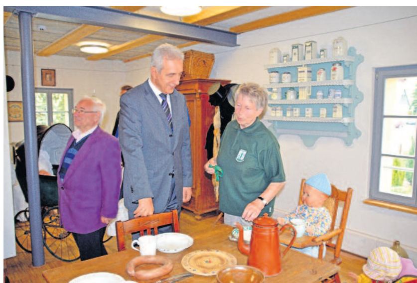
Im Mai 2014 ist es endlich soweit: das neue Dorfgemeinschaftshaus wird eingeweiht. Hier fand auch die Heimatstube ein neues Domizil. Zu Gast war auch der damalige Ministerpräsident Stanislaw Tillich.