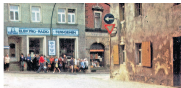
Sozialistische Wartegemeinschaft vor dem Fleischerladen.