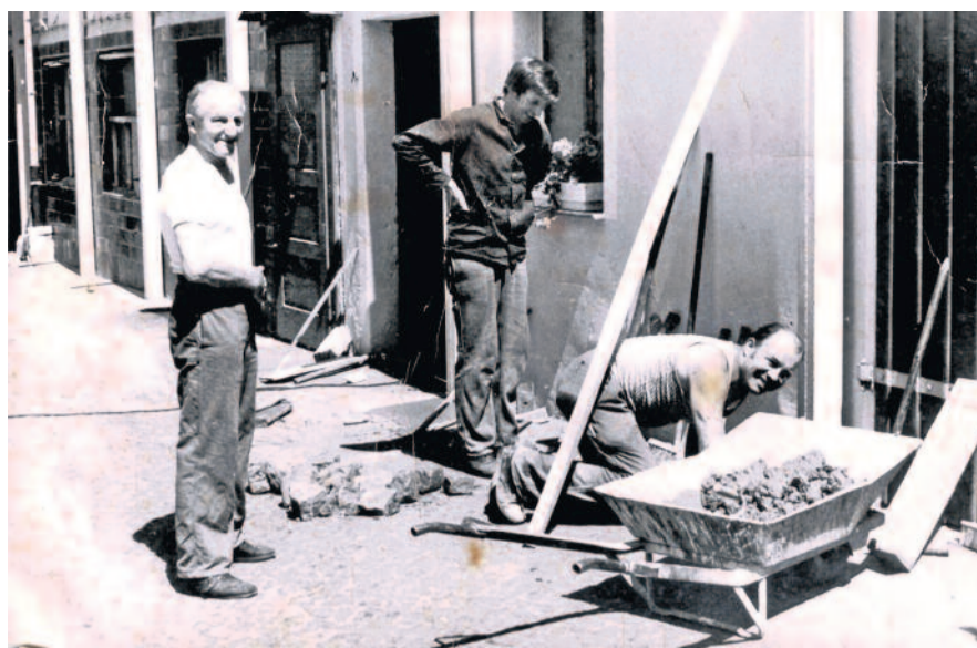
Mangels Handwerkerkapazitäten wurden Reparaturen und Modernisierungen meist in Eigenleistungen erbracht. Hier zum Beispiel der Bau einer Rohrbahn.

Das Angebot an Fleisch schrumpfte drastisch. So gab man Kundenkarten heraus.