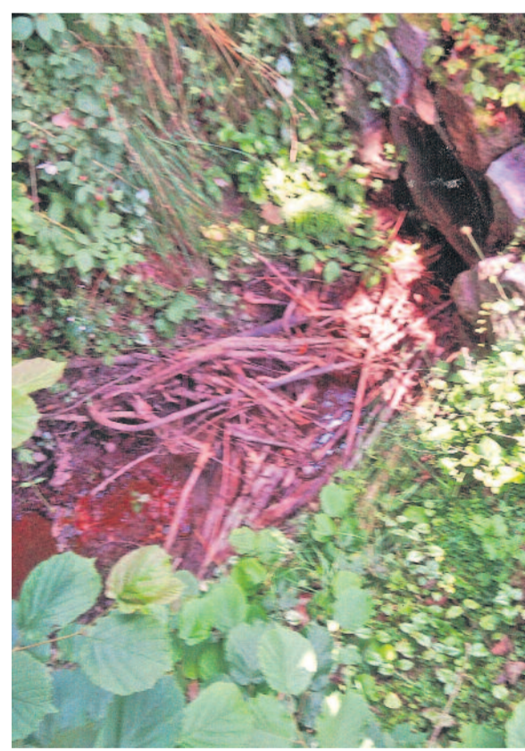
Kaum noch zu erkennen, der eingewachsene und zugeschwemmte Rohr-Einfluß des Silberbaches

Der Silberbach quert die Juri-Gagarin-Straße und ist in eine ca. 300 Meter lange Röhre gezwängt bis hin zur Ferdinand-Freiligrath-Straße und oben darauf ist noch der Rodelberg geschüttet wurden.