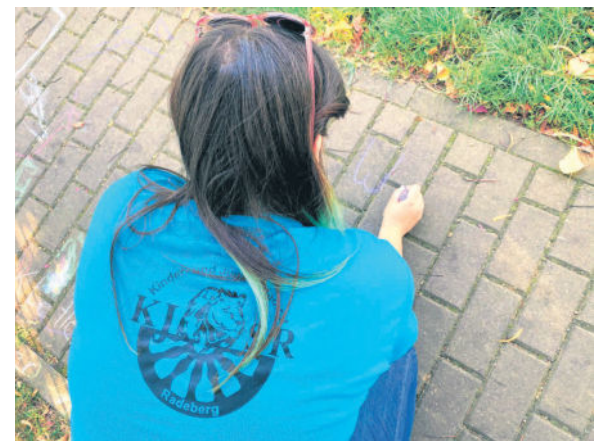
Regelmäßig ist der Kinder- und Jugendstadtrat unterwegs zum Spielplatz-Check.

Alle sind froh, dass es im Juni wieder losgehen konnte. Es fällt auf, dass die Kids eher etwas draußen machen wollen weil sie im Lockdown viele Stunden sowohl schulisch als auch in der Freizeit vor den elektronischen Geräten verbracht haben. Nach 10 Jahren Aufbauarbeit hat sich unsere Gemeinschaft sehr gut zusammengefunden und hält auch trotz der Pandemie an den Plänen fest. Ein größeres Projekt, welches noch vorgestellt wird, geht über die aktuelle Legislaturperiode des KJSR hinaus und trotzdem wollen die meisten irgendwie dabei bleiben oder sich erneut zur Wahl stellen.