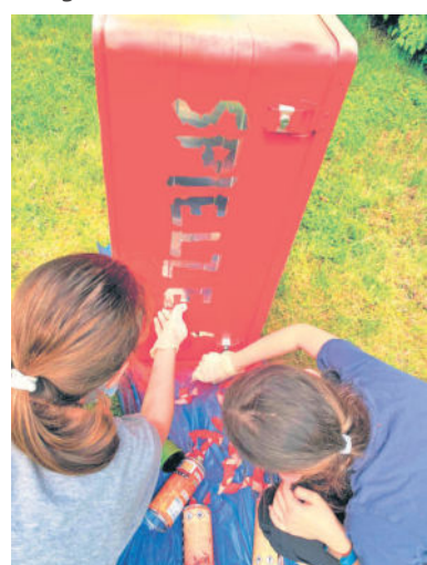
Zu den aktuellen Projekten gehören auch die Spielboxen. Unterschiedlich gestaltet einhalten sie tolle Spielsachen für Spielplätze oder auch zum Ausleihen. Nähere Informationen dazu folgen.