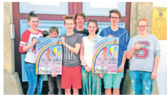
Das erste Vorkinderttagsfest in Radeberg ist ein voller Erfolg.

Welche Projekte sind in den zurückliegenden Jahren gewachsen? Es sind wunderbare Kooperationen entstanden. Aus-