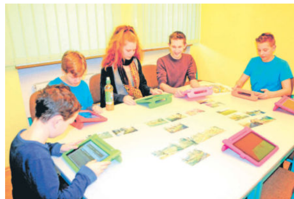
Kreative Ideensuche zum Thema Grünes Band Radeberg im Januar 2017.