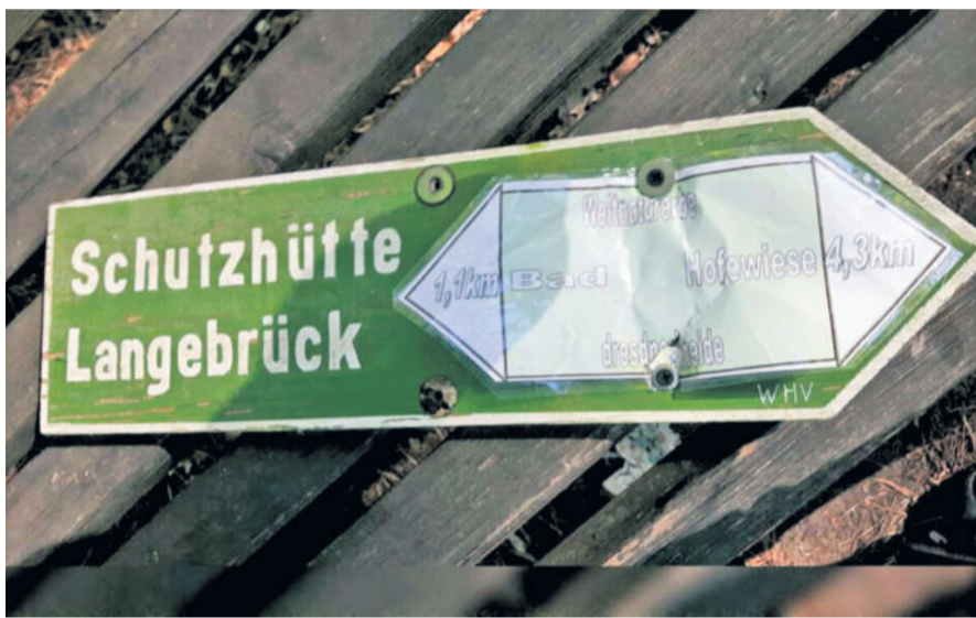
Dieser Wegweiser wurde mit einem Plastikschild überklebt. Es sorgt für Verwirrung.

dorf, Langebrück, Hermsdorf und Liegau-Augustusbad bekannt. Die Ermittler gehen davon aus, dass die Täter per Fahrrad unterwegs waren und Werkzeug dabei hatten. Die Polizei ermittelt wegen Sachbeschädigung und sucht Zeugen. Hinweise nimmt die Polizeidirektion Dresden unter der Rufnummer (0351) 4832233 entgegen.