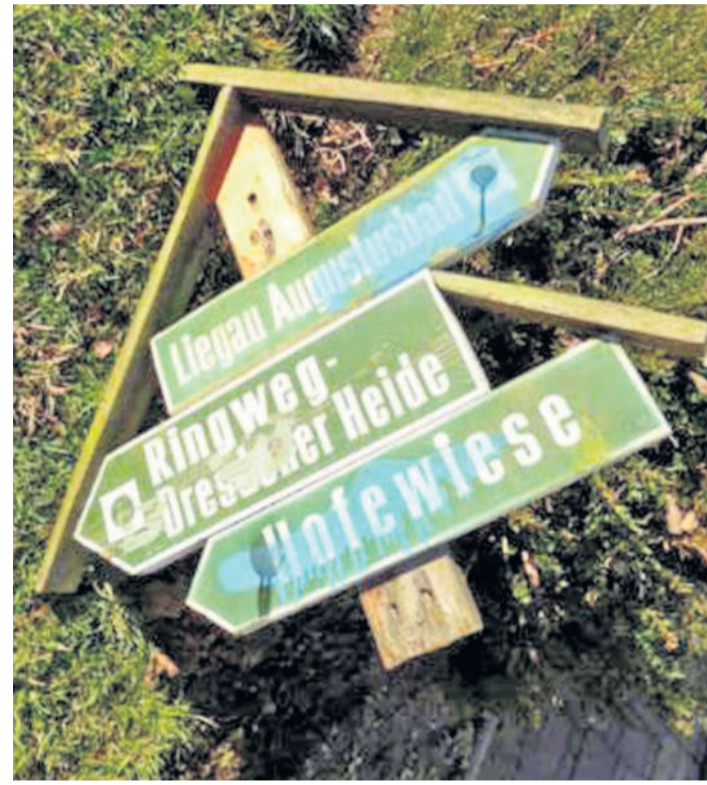
Auch Schilder wurden beschmiert.