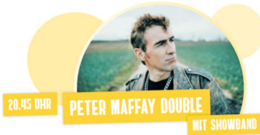
20.45 UHR PETER MAFFAY DOUBLE MIT SHOWBAND

„Die MAFFAY TRIBUTE SHOW“ für alle Fans und die, die es noch werden wollen. Das professionelle Double lebt den beliebten Star.