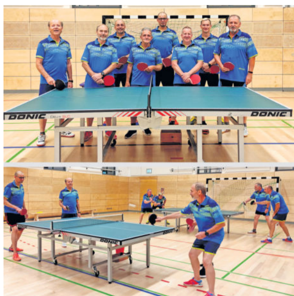
Die Mannschaft aktuell in der neuen Halle mit neuen Trikots

Vor 35 Jahren, 1986, trafen sich erstmals einige Tischtennisfreunde aus Ullersdorf und Umgebung zum gemeinsamen Spiel an den grünen Tischen.