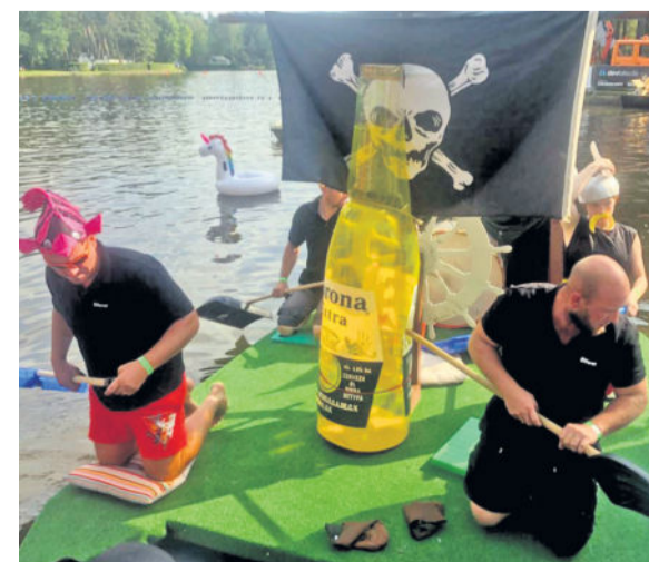
Die Besatzung des Langebrücker Bootes.