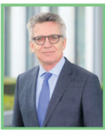
Thomas de Maizière