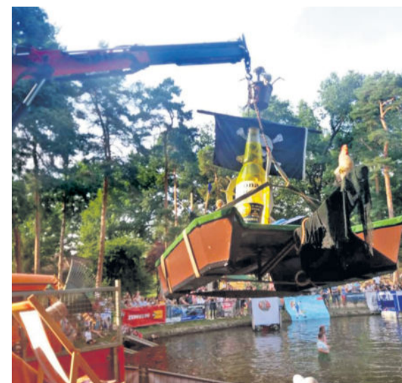
Das Latollka-Boot am Haken.