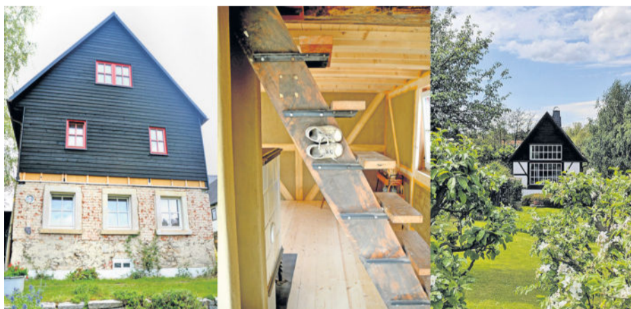
Wie man alte Substanz erhält, konnte man im ehemaligen Wohn- und Atelierhaus von Werner Juza in Wachau bestaunen.