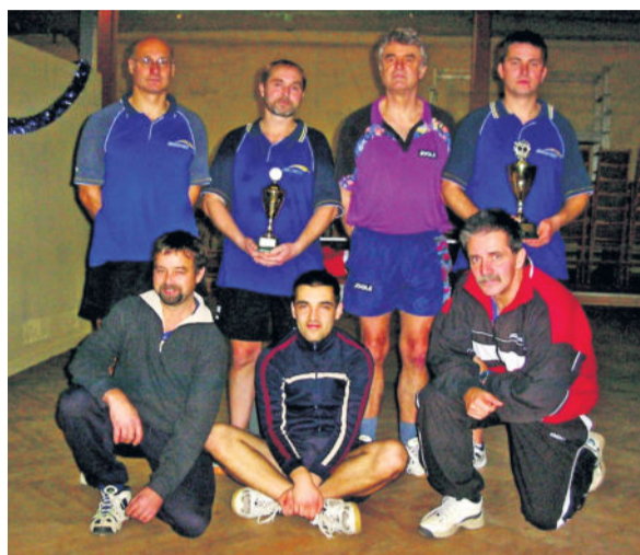
Teilnehmer interne Meisterschaft 2005

Großen Zuspruch fand auch die Nachwuchsförderung, die leider im Laufe der Zeit wieder eingestellt werden musste. Gründe dafür waren u. a. fehlende ausgebildete Trainer und der damit verbundene Aufwand für die bis dahin wenigen freiwilligen Tischtennispieler. Nach einigen Jahren Training wollten die Sportfreunde aus Ullersdorf mehr, als nur einmal pro Woche trainieren. 2002 stiegen sie in den Punktspielbetrieb ein. Sie wurden in die 4. Kreisklasse Kamenz eingestuft und schafften einen sensationellen Durchmarsch ohne eine einzige Niederlage in die 1. Kreisklasse. Schrittweise wurde der Saal in den 90-iger und Zweitausender Jahren modernisiert. Dennoch konnte ein Abriss 2015 nicht verhindert werden. 2017 entstand am selbigen Ort eine Mehrzweckhalle, wodurch sich die Spiel- und hygienischen Bedingungen für den Teamsport an der Dresdner Heide wesentlich verbessert