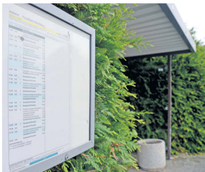
„Fischbach ist abgehängt“ - mehrere Buslinien wurden hier bereits gestrichen. Die Fahrzeiten sind sehr überschaubar. Begründung der Verantwortlichen: Im benachbarten Arnsdorf ist ein Bahnhof.