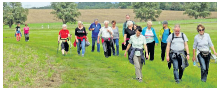
Die Teilnehmer absolvierten 14 Kilometer.

Turnverein Langebrück lud zur Familienwanderung / 22 Teilnehmer waren mit dabei