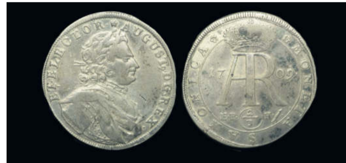
Zu sehen ist ein Gulden aus dem Jahr 1709, geprägt in der Münzstätte Leipzig (Münzzeichen EPH). Das Stück stammt aus der Zeit nach dem Verzicht auf die polnische Königskrone. Es handelt sich um den sogenannten „Monogramm-Gulden“. Die Vorderseite zeigt das Brustbild von Friedrich August dem Starken. Rückseitig ist das Monogramm „AR“ (für die lateinischen Worte „Augustus Rex“, also „König August“) zu sehen. Bemerkenswert ist, dass auf dem Stück auch in der Umschrift August als König („Rex“) ausgewiesen wird, jedoch wird dabei kein Bezug zu Polen genommen.