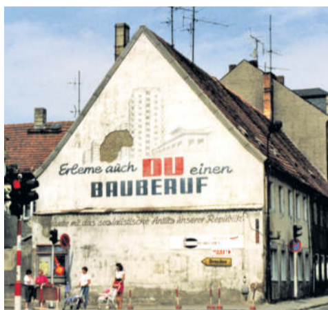
Ein Foto von 1992 mit der Giebelwand des Gebäudes an der Kreuzung Pulsnitzer Straße / Oberstraße, an welcher der markante Spruch „Erlerne auch du einen Bauberuf“ stand.