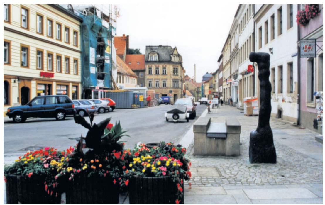
Kleinmarkt und Hauptstraße 1996.

Über 30 Jahre ist es nun her, als die städtebauliche Gesamtmaßnahme „Innenstadt“ Radeberg 1991 in das Landessanierungsprogramm „Städtebauliche Erneuerung“ (LSP) mit Bescheid vom 08.08.1991 aufgenommen wurde. Im Anschlussprogramm erfolgte 1993 die Aufnahme in das Bund-Länder-Programm „Städtebauliche Erneuerung“ (SEP) mit Bescheid vom 04.10.1993. Nach der Wende zeigte sich Radebergs Stadtmitte trist, grau und teilweise verfallen. Doch die Verantwortlichen krepelten motiviert die Ärmel hoch, schafften die Grundlagen für das Sanierungsgebiet Innenstadt und die Verwandlung nahm ihren Lauf. Es war eine Zeit des Aufbruchs und eine ganze Generation startete mit neuen Ideen und mutigen Plänen. Ein Haus nach dem anderen wurde saniert, Geschäfte zogen wieder ein, Menschen fanden in modernisierten Wohnungen ein neues Heim. Das ein oder andere Gebäude fiel den Abrissbaggern zum Opfer, etliches wurde neu aufgebaut. Die Stadt selbst sanierte die Hauptstraße und den Markt grundhaft. Das sorgte damals zwar zu Recht für jede Menge Verkehrschaos und Ärger bei Anwohnern und Händlern, ist aber aus heutiger Sicht ein wichtiger Meilenstein auf dem Weg zur attraktiven Innenstadt gewesen. Doch was bedeutet Innenstadt heute?