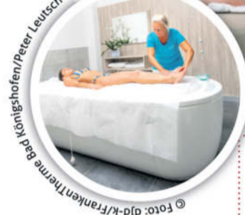
Bad Königshofen im Naturpark Haßberge

Das „Männlichkeitshormon“ Testosteron fördert beim Mann nicht nur Lust und Potenz, es hat auch Auswirkungen auf den Stoffwechsel. So begünstigen etwa niedrige Testosteronspiegel die Entstehung von Übergewicht. Gleichzeitig hemmen Botenstoffe im Bauchfett die Testosteronproduktion. Übergewicht geht wiederum häufig mit Diabetes Typ 2 einher. Eine neue Studie zeigt nun, dass sich durch eine Testosterontherapie bei niedrigen Testosteronwerten die Entstehung eines Typ-2-Diabetes verhindern oder bei kürzlich diagnostizierten Männern rückgängig machen lässt. Bei Übergewicht und/oder Diabetesrisiko sollten Betroffene ihre Testosteronwerte ärztlich prüfen lassen. Schnelltest unter www.mannvital.de .