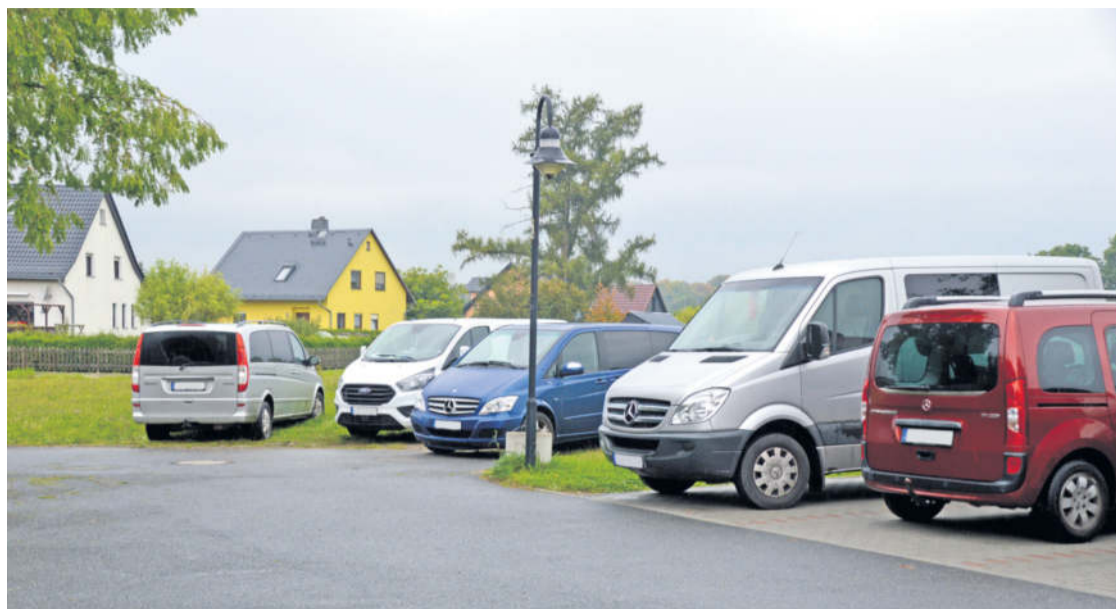
Vor der Kita Tausendfüßler stehen nur 4 Kurzzeitparkplätze zur Verfügung. Zu den Stoßzeiten stehen die Fahrzeuge deshalb meist auf der angrenzenden Wiese, doch das ist verboten.