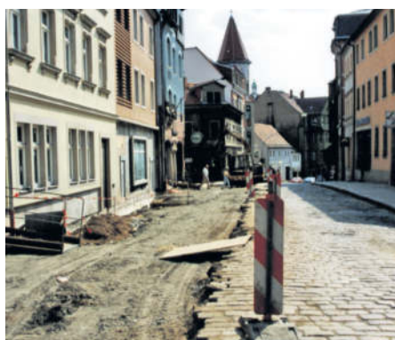
Foto rechts: Straßenbau an der Hauptstraße 17 - 19 im Frühjahr 2000.