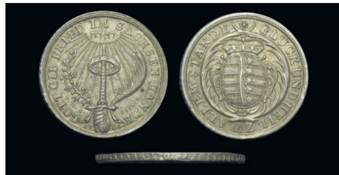
Zu sehen ist eine Silbermedaille aus dem Jahr 1707. Geschaffen wurde das Stück auf den „Frieden zu Altranstädt“ im Jahr 1706 sowie auf den Wunsch nach Frieden im neuen Jahr 1707. Die Vorderseite zeigt ein Schwert, darüber befindet sich in hebräischer Schrift der strahlende Name Gottes („Jehova“). Auf der Rückseite ist das Wappen von Sachsen mit Kurhut zu sehen. Sowohl die Vorder- als auch die Rückseite tragen sich reimende Umschriften, die den Wunsch der Bevölkerung nach Frieden ausdrücken. Interessant ist die Randgestaltung - diese wurde auch mit einer durchgehenden Schrift versehen. Gefertigt wurde das Stück von Medailleur Christian Wermuth aus Gotha, ein bedeutender Medailleur des Barock.