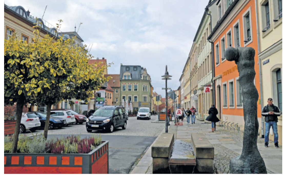
Kleinmarkt und Hauptstraße Oktober 2021.

Der Handel hat sich verändert. Vor 30 Jahren war an eine Konkurrenz im Internet überhaupt nicht zu denken, nur die großen Einkaufstempel machten den kleinen Läden nach der Wende schon langsam die Kunden streitig. Eine ganz neue Einkaufskultur schwappte aus dem Westen herüber und zog die Neugier und Aufmerksamkeit der Konsumenten auf sich. Heute bedarf es schon mehr als ein buntes Warenangebot oder schrill beworbene Dienstleistungen. Spezielle Angebote, große Rabattschilder, individueller Service und Ausverkauf rund um das Jahr locken die Menschen in die Geschäfte. Was bleiben dem kleinen Laden um die Ecke für Möglichkeiten, ihre Waren gewinnbringend anzubieten?