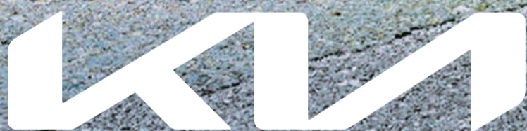
Abbildung zeigt kostenpflichtige Sonderausstattung.

Lass aus Inspirationen neue Möglichkeiten werden. Entdecke mit dem neuen Kia Sportage eine vielfältige Auswahl an Motorisierungen - vom effizienten Verbrenner bis hin zum zukunftsweisenden alternativen Antrieb. Erlebe den neuen Kia Sportage jetzt bei einer Probefahrt.