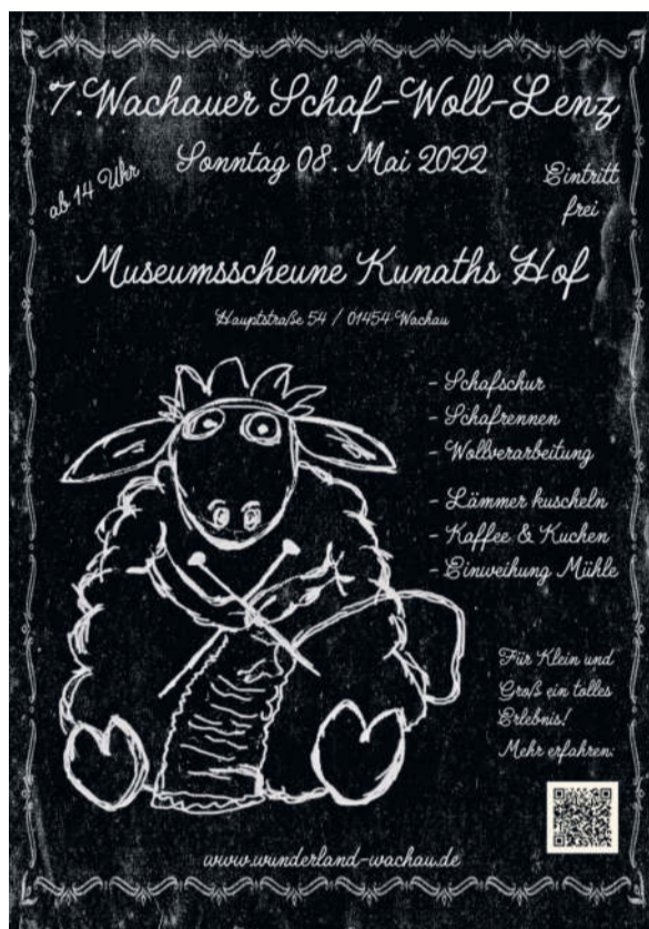
Text: Wunder Land e.V.

Kunaths Hof ist ein magischer Ort! Eingebettet in der Region Westlausitz unweit von Dresden und Radeberg, ist er ein Paradies für alle, die Geschichte, Kunst und Kultur lieben. Die Museumsscheune ist voller Schätze, und der Verein Wunder Land e.V. bietet eine virtuelle 3D-Tour an, die es Menschen aus aller Welt ermöglicht, diesen wunderbaren Ort zu besuchen. Im 3D Rundgang und auf der Website finden Besucher viele emotionale Videoclips, Informationen und Bilder über die Museumsscheune und das Vereinsleben von Wunder Land e.V. in Wachau bei Dresden. Der virtuelle Rundgang ist ein immersives Erlebnis, das Sie in die Vergangenheit von Kunaths Hof versetzt. Ob Sie nun ein Geschichtsfan sind, ein Kunstliebhaber oder einfach jemand, der gerne etwas über andere Menschen und Orte erfährt.