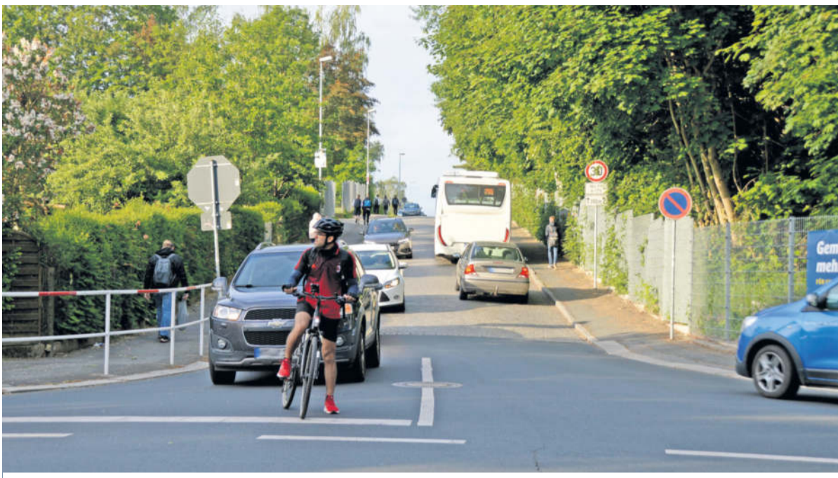
Hier ist besondere Rücksicht gefragt: Die Kreuzung Heidestraße / Robert-Blum-Weg ist im Berufsverkehr stark frequentiert.

vorgenommen. Die Verbesserung der Straßenbeleuchtung zwischen der Kreuzung Heidestraße / Robert-Blum-Weg und Heinrich-Gläser-Straße ist nach Einschätzung der Stadtverwaltung derzeit nicht möglich. Ein großer Wunsch der Elternschaft und auch der Lehrer wäre zudem eine dauerhaft installierte Tempotafel, welche auf die Geschwindigkeitsbegrenzung von 30 km/h aufmerksam macht. Bisher gibt es eine Tempotafel, welche jedoch nicht nur vor der Grundschule Süd, sondern auch an anderen gefährlichen Stellen in Radeberg zum Einsatz kommt. Dieses Vorhaben wollte der