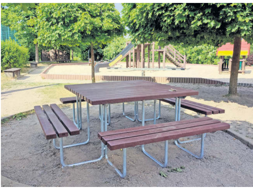
Die neue Sitzgruppe auf dem Schulhof der Heideschule.

würde. Im Anschluss ging es im Hüttertal weiter, mit dem nötigen Streichen der Sitzbänke und dem Aufräumen des „Grünen Klassenzimmers“. In der Heideschule stellte die Klasse 8a neue „Chillmöbel“ auf, reparierte etliche Bänke und montierte eine neue Sitzgruppe im Schulgelände. In der Pestalozzi-Schule wurde der große Fahrradstellplatz der Schule von 15 Schüler*innen grundgereinigt, damit eine geplante Graffitiaktion starten kann.