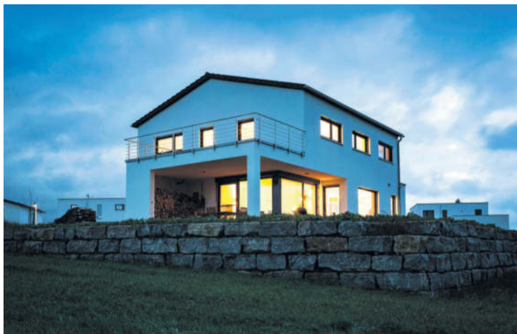
Zertifizierte Sicherheitssysteme lassen sich den Lebensumständen anpassen und können auch Smart-Home-Funktionen mit übernehmen.