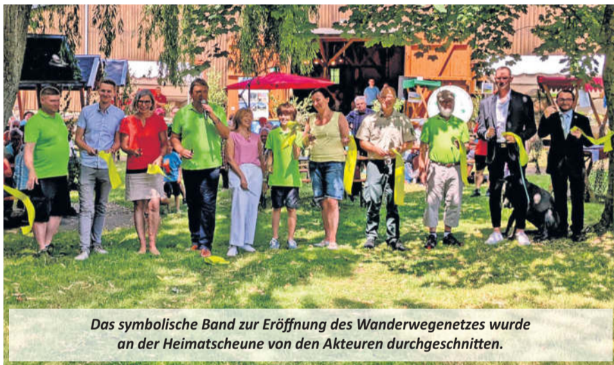
Das symbolische Band zur Eröffnung des Wanderwegenetzes wurde an der Heimatscheune von den Akteuren durchgeschnitten.

Aktuell kann sie bereits unter www.westlausitz.de/information.html bestellt werden.