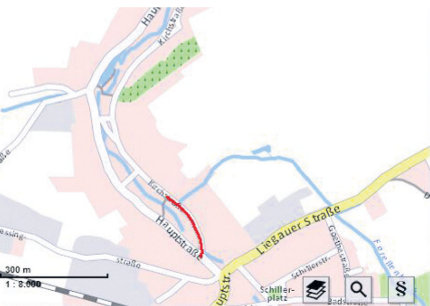
Im Themenstadtplan der Stadt Dresden ist die Sperrung in der Kirchstraße bereits eingezeichnet. Der Bereich ist über Monate voll gesperrt.

mann, lud mit befreundeten Vereinen zur Sommerfaschingssause. Dass die Langebrücker solch ein Event können, hatten sie nicht nur im vergangenen Jahr auf der Hofwiese, sondern auch bei den legendären Bad- und Sportfesten eindrucksvoll unter Beweis gestellt. Mehr zum Faschingsevent auf der Hofwiese in eine der nächsten Ausgaben der „Langebrücker Nachrichten“.