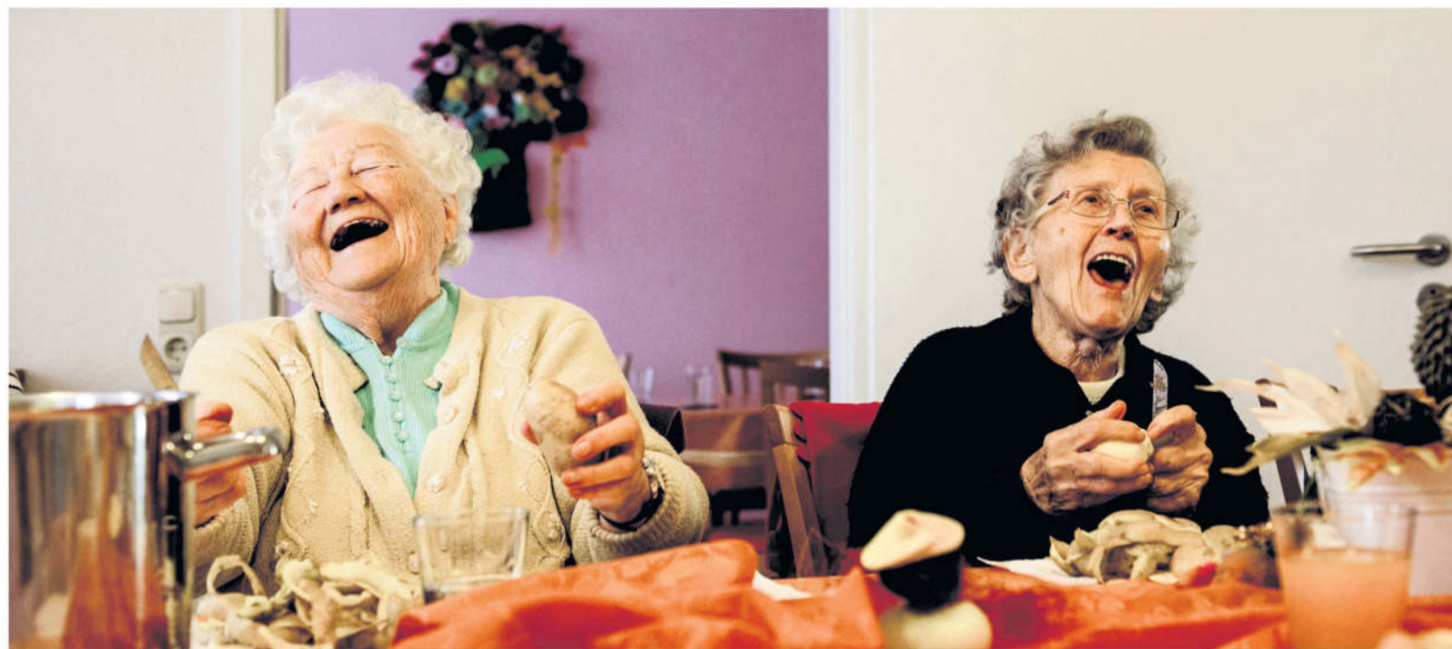
Gerüche und Geschmäcker wecken Erinnerungen und die gemeinsame Zubereitung macht Spaß und erhält Fähigkeiten. Deshalb wird bei advita jeden Tag frisch gekocht. Die Bewohner und Tagesgäste werden in die Speisenplanung und deren Zubereitung mit einbezogen.

Was heißt das konkret? Das Budget, das für die Tagesbetreuung von der Pflegekasse bezahlt wird, definiert sich in der Höhe am Pflegegrad. Wer also zum Beispiel einen Pflegegrad 2 hat, erhält einen geringeren Betrag als jemand mit einem hohen Pflegegrad. Dieser Betrag kann dann in einer Tagespflege eingesetzt werden,