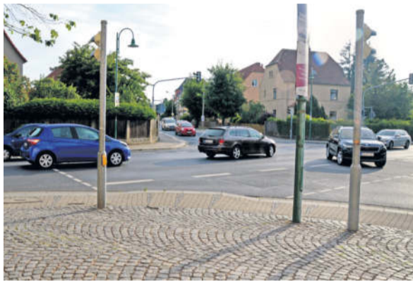
An der Kreuzung Heidestraße / Schillerstraße / Richard-Wagner-Straße hat es schon oft „gekracht“. Um mehr Sicherheit für Fußgänger zu schaffen, könnte ein Gelbblinker für den Abbiege-Vorgang eingerichtet werden.

Große Sorge gibt es zudem auch stadtauswärts am Quantzweg, welcher in die vielbefahrene Dresdener Straße mündet. Es gibt keine Fußwege an der Trasse, die in die Dresdener Heide führt. Auch das Tempo der Fahrzeuge ist mitunter viel