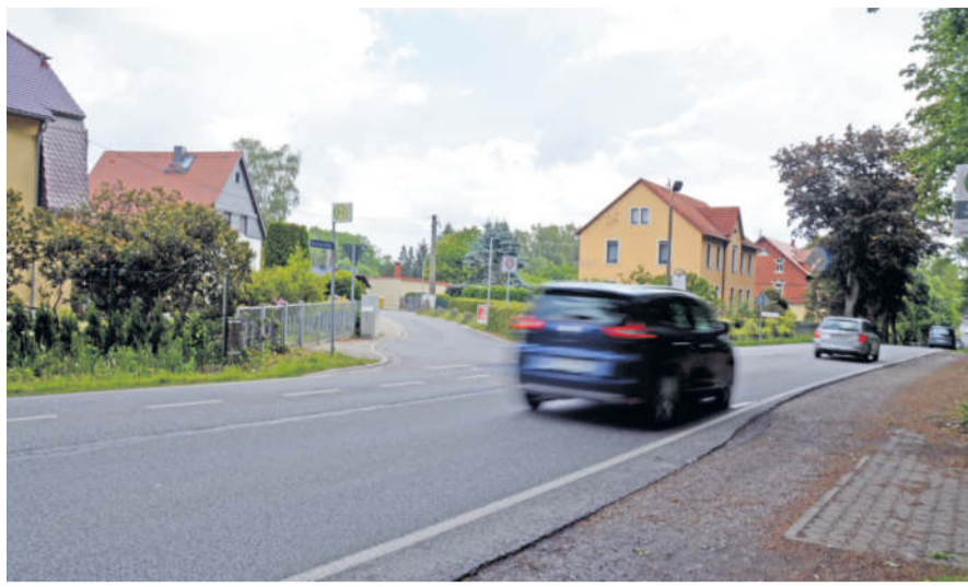
Ein Verkehrsschwerpunkt, welcher auch einige Schulkinder der Grundschule Süd betrifft, ist die Dresdener Straße am Abzweig Quantzweg. Kaum vorhandene Gehwege und überhöhte Geschwindigkeit werden hier besonders kritisch bewertet.

Suche Hausmeister für Raum Radeberg und Umland, in Teilzeit oder Vollzeit, gern auch älter. Tel. 0163 - 872 00 15