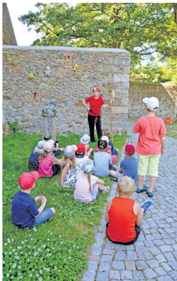
Das Team von Schloss Klippenstein