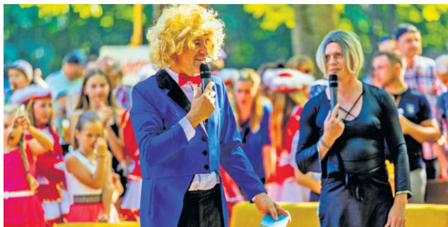
Thomas Gottschalk und Michelle Hunziker moderierten „Wetten, dass“.

Übrigens, so lange müssen alle Karnevalsfreunde gar nicht mehr warten, bis der Schlachtruf „Latollka, Ha, Ha“ in der Ortschaft ertönt. Denn zur Neuaufgabe des Waldbadfestes darf selbstverständlich die Faschingssause nicht fehlen. Am 3. September, Beginn ist um 18.00 Uhr, heißt es: „Was Neues in Langebrück? LATOLLKA hat's! Das Waldbad wird zum Campingplatz.“