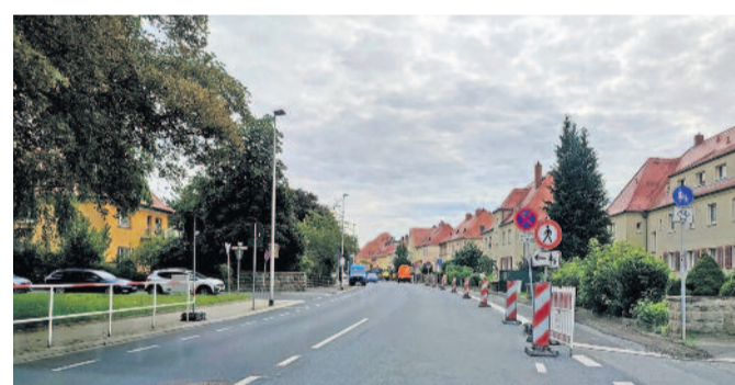
Verkehrseinschränkungen auf der Heidestraße, der Breitbandausbau sorgt momentan für neues Gefahrenpotenzial an der Grundschule Süd.

Radeberg hat seit kurzem nun seinen ersten Fußgängerüberweg, auch Zebrastreifen genannt. Dieser wurde an der Grundschule Großerkmannsdorf installiert und ersetzt die zurückgebaute Verkehrsinsel. Allerdings fragte man sich gleich am ersten Schultag, ob die Autofahrer das Verhalten am Fußgängerüberweg aus der Fahrschule eigentlich noch kennen? Wie wir von Eltern erfahren, brauste so mancher trotz Kindern am Überweg einfach durch. Laut Straßenverkehrsordnung ist an einer solchen Anlage allerdings folgendes zu beachten: § 26 StVO (1) An Fußgängerüberwegen haben Fahrzeuge (mit Ausnahme von Schienenfahrzeugen) den zu Fuß Gehenden sowie Fahrenden von Krankenfahrstühlen