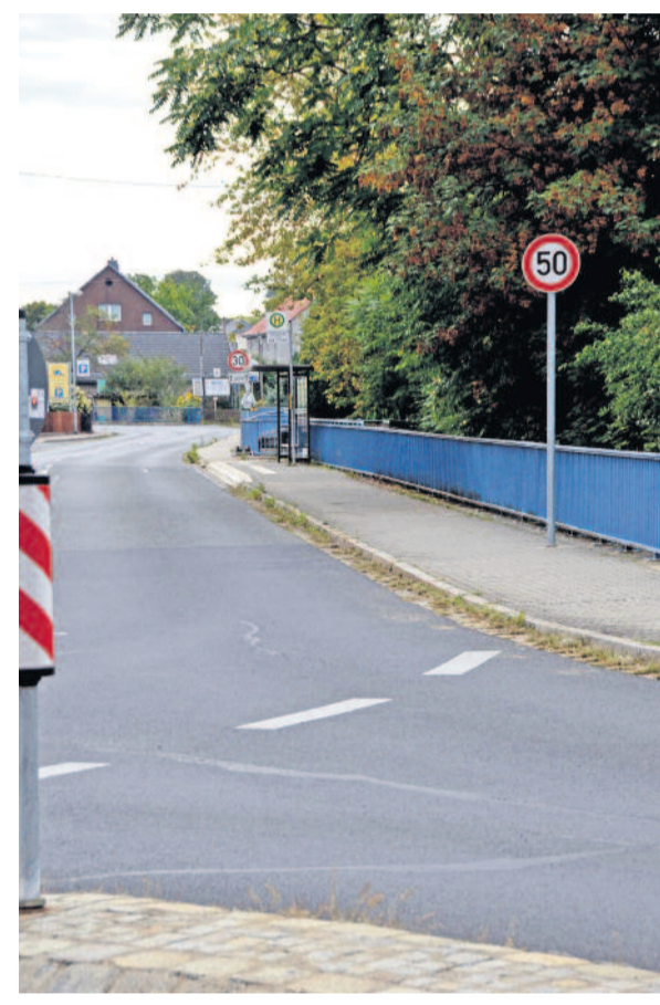
Ist das richtig? Das fragt man sich gerade in Großerkmannsdorf. Sollte die Tempo-30-Begrenzung nicht schon vor der Bushaltestelle beginnen?

Radeberg hat seit kurzem nun seinen ersten Fußgängerüberweg, auch Zebrastreifen genannt. Dieser wurde an der Grundschule Großerkmannsdorf installiert und ersetzt die zurückgebaute Verkehrsinsel. Allerdings fragte man sich gleich am ersten Schultag, ob die Autofahrer das Verhalten am Fußgängerüberweg aus der Fahrschule eigentlich noch kennen? Wie wir von Eltern erfahren, brauste so mancher trotz Kindern am Überweg einfach durch. Laut Straßenverkehrsordnung ist an einer solchen Anlage allerdings folgendes zu beachten: § 26 StVO (1) An Fußgängerüberwegen haben Fahrzeuge (mit Ausnahme von Schienenfahrzeugen) den zu Fuß Gehenden sowie Fahrenden von Krankenfahrstühlen