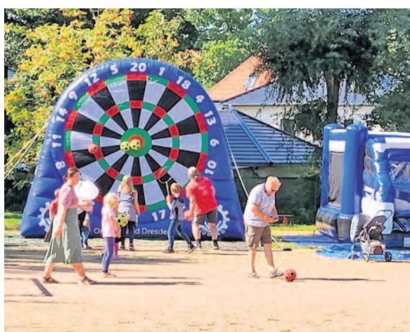
Sonntag war Familienfest.