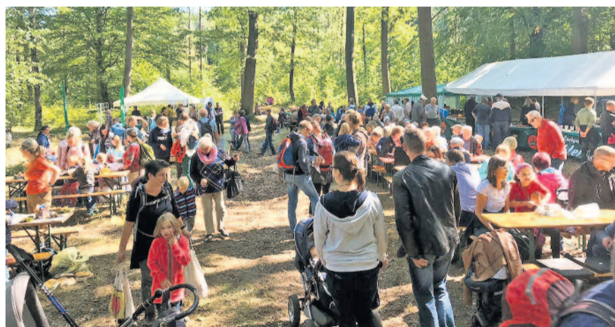
Zuletzt konnte das Saugartenfest im Jahr 2019 gefeiert werden. Nach der coronabedingten Zwangspause steht nun die nächste Ausgabe an.

Los geht es um 10.00 Uhr mit der Eröffnung durch die Jagdhornbläser und die Begrüßung durch den Forstdirektor Heiko Müller. 11.00 Uhr ist ein Puppenspiel für Kleine und Große von Marco Vollmann vorgesehen. Zu einer zweistündigen Wanderung durch die Dresdner Heide, die um 13.00 Uhr startet, lädt Forstdirektor Heiko Müller alle Interessierten ein. Auf dem