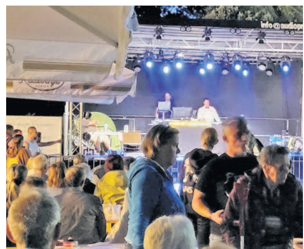
Am Sonnabend lud der Karnevalsverein zum Fasching ein.