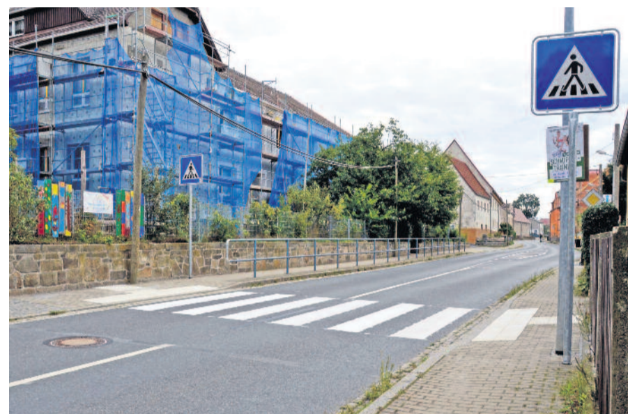
Zur Sicherheit von Kindern und Fußgängern - laut StVO haben Fahrzeuge den zu Fuß Gehenden das Überqueren der Straße zu ermöglichen. In Großerkmannsdorf scheint dies momentan noch nicht so gut zu funktionieren.