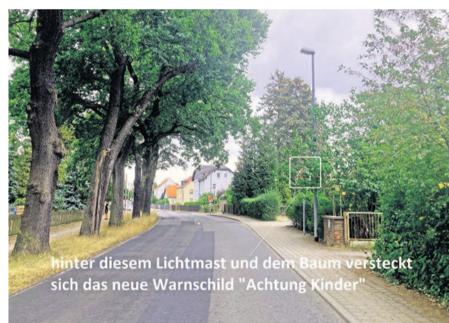
hinter diesem Lichtmast und dem Baum versteckt sich das neue Warnschild "Achtung Kinder"

oder Rollstühlen, welche den Überweg erkennbar benutzen wollen, das Überqueren der Fahrbahn zu ermöglichen. Dann dürfen sie nur mit mäßiger Geschwindigkeit heranzufahren; wenn nötig, müssen sie warten.