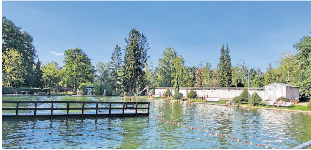
Zahlreiche Besucher genossen in diesem Jahr wieder die Sonne und suchten die Abkühlung im Waldbad.