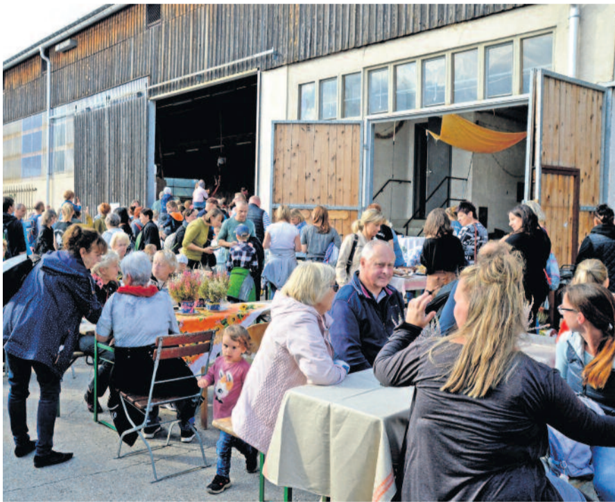
Das sonnige Wetter nutzten viele Besucher, um sich beim Wunder Land e.V. in Wachau umzuschauen und das Programm zu sehen.