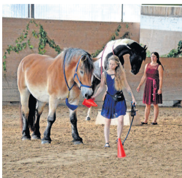
Neben den Pferden, die unter den Blicken der zahlreichen Zuschauer eine tolle Vorstellung gaben, standen auch andere Tiere, wie Schafe, Esel und Hühner im Mittelpunkt.