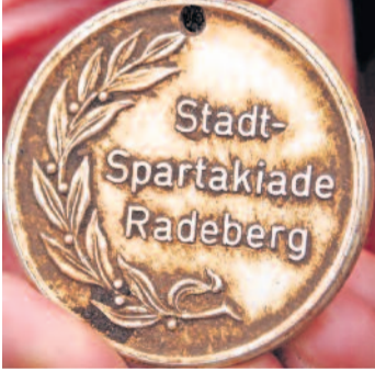
Ein kurioses Fundstück fanden die Jugendlichen beim Sammeln von Müll. Die Plakette der Radeberger Stadtspartakiade stammt aus dem Jahr 1980.

Hinter dem Garagenhof der Elsa-Fenske-Straße wurden von der zweiten Gruppe die Wegesränder um den Teich von Ästen und Gestrüpp freigeschnitten. Nicht weit entfernt, sah man eine größere Anzahl an Floriansjungern, welche 235 Sträucher einpflanzten. Unter der Anleitung von Frau Krause, der Revierförsterin, konnten Schlehen, Weißdorne, Hartriegel und Pfaffenhütchen-Setzlinge in die Erde gepflanzt werden. In der Nähe des Gebietes der Pflanzung war auch die vierte Gruppe beschäftigt. Diese hat zum Teil den Weg freigeschnitten, um anschließend die Pfähle für einen neuen Wildzaun zu setzen, eine sehr anspruchsvolle Arbeit für die schon älteren Jugendlichen. Mit viel Engagement und Eifer waren alle bei der Sache. Während einer kurzen Teepause, konnte sich die ein oder andere kalte Hand schnell wieder aufwärmen. Zur Mittagszeit waren alle Arbeiten erledigt. Vor der Rückfahrt, diesmal mit den Fahrzeugen, mussten noch fleißig Schuhe geputzt werden. Die Unmengen Schlamm wollte man im Wald lassen, deshalb richtete das Löschfahrzeug von Großerkmannsdorf kurzerhand eine Schuhwaschanlage für alle Stiefel ein.