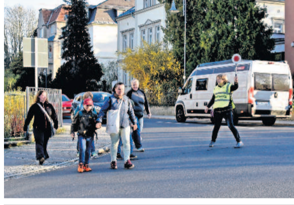
Text & Fotos: Red.