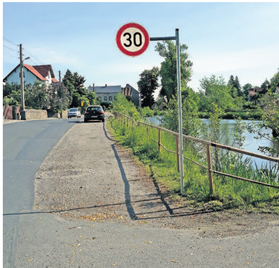
Im Mai 2022 hieß es aus dem Rathaus, dass mit der Vorstudie zum Ausbau der Klotzcher Straße / Hauptstraße frühestens zum ersten Quartal 2023 gerechnet werden könnte. Ein Jahr ist vergangen, passiert ist bis dato nichts.

Einstimmig fällten die neun Ratsmitglieder folgenden Beschluss: Der Ortschaftsrat stellt fest, dass sämtliche Fertigstellungstermine für die Machbarkeitsstudie zum Ausbau der Klotzcher Straße / Hauptstraße nicht eingehalten wurden. Der Oberbürgermeister wird aufgefordert, dem Ortschaftsrat einen Zeitspiegel mit Zwischenterminen zur Vergabe der Planungsleistungen, zur Vorstellung des Entwurfs der Studie in der Verwaltungsstelle, zum Abschluss der Machbarkeitsstudie und zur Beratungsfolge der Gremien bis zum Beschluss im Stadtrat bis zum 30. Mai 2023 vorzulegen. Dabei verlegen sie den Termin sogar noch einen Monat nach vorn, denn im Beschlussvorschlag ist zu lesen, dass bis zum 30. Juni 2023 Zeit ist. Nun gilt der 30. Mai. 2023.