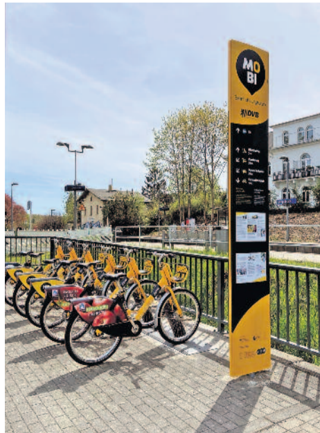
Vergangene Woche erfolgte die offizielle Einweihung in der Ortschaft.

Aus der Dresdner Innenstadt sind die gelben Fahrräder des MOBibike-Verleihsystems nicht mehr wegzudenken – die dezentralen Stadtteile gehörten dagegen bisher nicht zum Ausleihgebiet. Ab sofort wird das Angebot der Dresdner Verkehrsbetriebe (DVB) erstmals im Praxistest auch auf Langebrück ausgeweitet und damit ein Außenbezirk mit dem neuen Angebot erschlossen. Wo am bisherigen MOBipunkt am Bahnhof Langebrück lediglich ein Carsharing-Stellplatz und vier Stellplätze mit