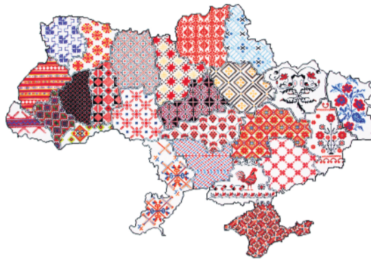
Je nach Region unterscheiden sich die Muster auf der traditionellen ukrainischen Kleidung, der Wyschyvanka.

Text: Red.; Foto: pixabay Karte: Verbreitung ukrainischer Muster nach Region (Copyright: Qypchak, CC BY-SA 3.0, via Wikimedia Commons)