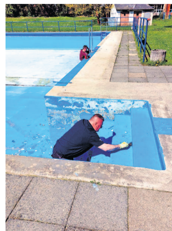
Bereits Ende April begannen die Arbeiten am Schwimmbecken.

Etliche Stellen müssen ausgebessert werden, bevor das Becken gestrichen werden kann. Nach 88 Jahren treten so manche Alterserscheinungen auf.