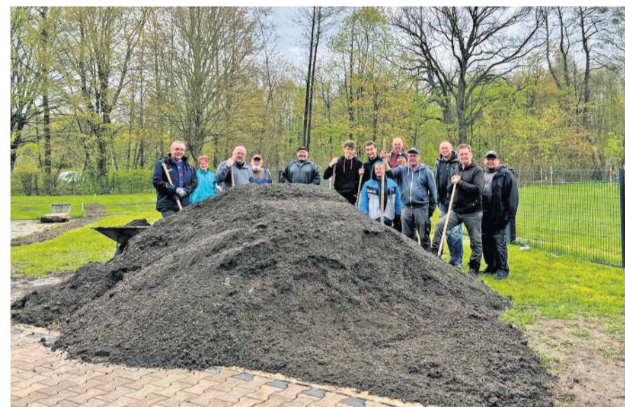
Gemeinsam wird angepackt, um das Ziel eines Mehrgenerationsgeländes umzusetzen.