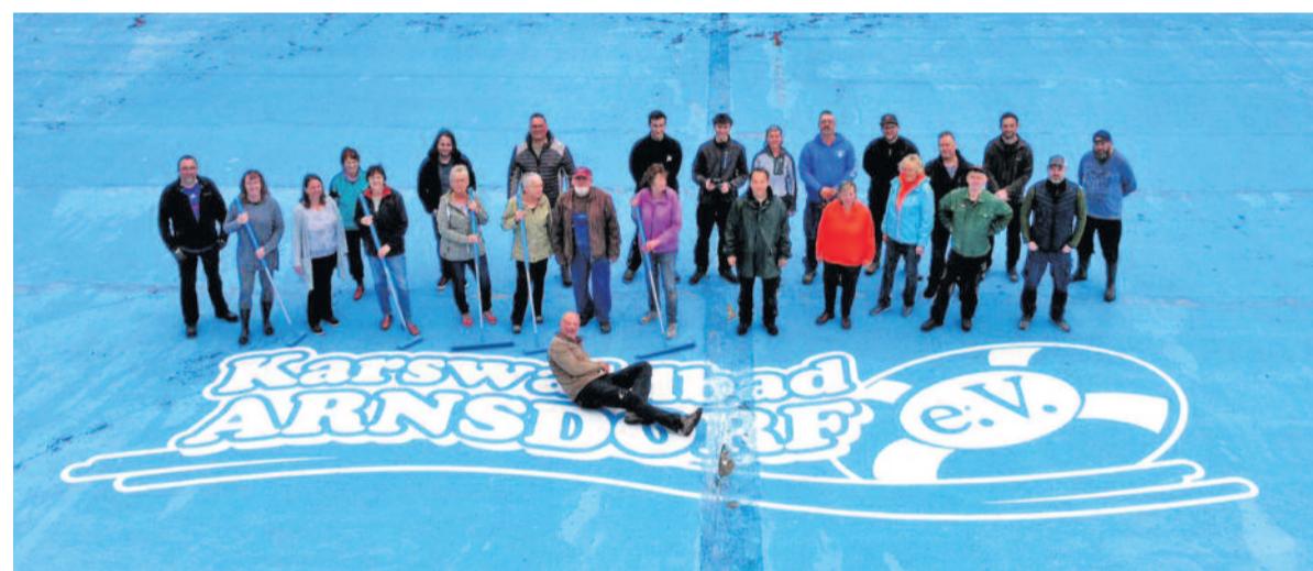
Arbeitseinsatz am vergangenen Wochenende. Bevor das Schwimmbecken mit Wasser gefüllt werden kann, bedarf es einiger Reparaturen.

zeit im Grünen zu verbringen. Es ist ein Treffpunkt für Familie, Freunde und Vereine. Es kann entspannt, aber auch Sport getrieben werden. Nicht zu vergessen sind die Veranstaltungen, welche das Erlebnisangebot im Karswaldbad abrunden.