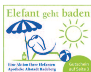
Eine Aktion Ihrer Elefanten Apotheke Altstadt Radeberg