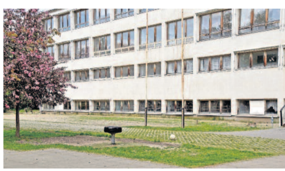
Mit dem Abriss der alten Plattenbauschule verschwindet auch der Bolzplatz der Hortkinder. Deshalb soll auf dem Hortareal umgestaltet werden. Die Tischtennisplatten bekommen einen neuen Standort und an ihrer Stelle wird ein neuer Fußballplatz entstehen. Für dieses kostenintensive Projekt legen der Hort und die Kita Karswald ihre Spendengelder zusammen. Für das Projekt kann gern noch gespendet werden. Insgesamt werden rund 25.000 Euro benötigt, 15.000 Euro kommen mit etwas Glück aus einem Fördertopf.

neuen Veranstaltungsort, auch hier wieder zu schauen, wo es eventuell Anpassungsbedarf gibt, um das Einkaufserlebnis unserer Gäste weiter zu steigern. Auf jeden Fall sind wir mit dem Wechsel des Veranstaltungsortes sehr zufrieden. Es ging soweit alles reibungslos über die Bühne.“