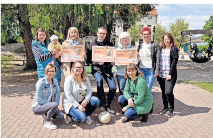
Insgesamt 2.183,79 Euro kamen zum Frühjahrsbasar für den guten Zweck zusammen. Alle drei Einrichtungen erhalten somit rund 728 Euro. Die Kita Tausendfüßler Fischbach möchte mit dem Geld die Grundlagen für einen Kinder-Yoga-Kurs schaffen und unter anderem Yogamatten kaufen.

Ein bisschen Wehmut schwingt mit, wenn man an die letzten Kindersachen-Basare in Arnsdorf denkt. Die Voraussetzungen in der alten Plattenbauschule waren einfach optimal. In den einzelnen ehemaligen Klassenzimmern konnten die Sachen übersichtlich sortiert und angeboten werden. Doch allen war klar, irgendwann kommt der Abriss - im Sommer dieses Jahres ist es nun soweit. Für das Team des Basar rund ums Kind hieß das, es musste ein neuer Veranstaltungsort gefunden werden. Die Wahl fiel auf die alte Turnhalle in unmittelbarer Nähe der Grundschule bzw. alten Plattenbauschule. So fand der 19. Basar am 24. & 25. März 2023 also wieder in einem großen Raum statt. Wie das Ganze abgelaufen ist, erzählte uns Ute Frey in einem kleinen Interview.