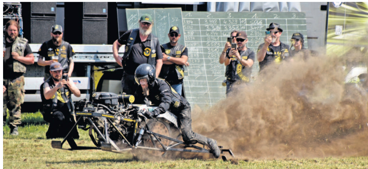
Beim Start wurde wieder jede Menge Staub und Dreck aufgewirbelt, der sogenannte „Auswurf“.