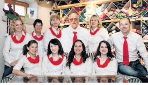
... Vielleicht fäden wir für Sie schon die nächste Reise ein.

Wir freuen uns auf Ihren Besuch Ihr Team von Reisebüro Moch