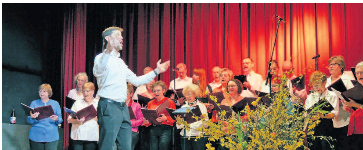
Wie bei ihrem Frühjahrskonzert präsentieren sich beide Langebrücker Ensembles, der Nicodé-Chor und die Nicodé Pop Vocals (Foto oben), beim Chortreffen auf der Hofewiese am 26. August.