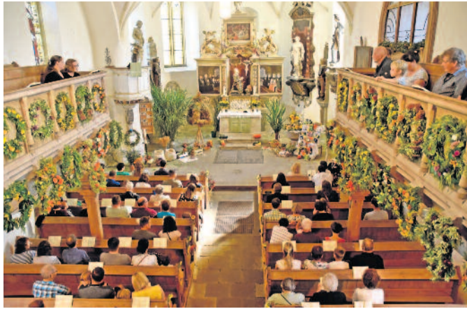
Zahlreiche Erntekränze schmückten die Seifersdorfer Kirche zum Erntedank-Gottesdienst am vergangenen Sonntag.