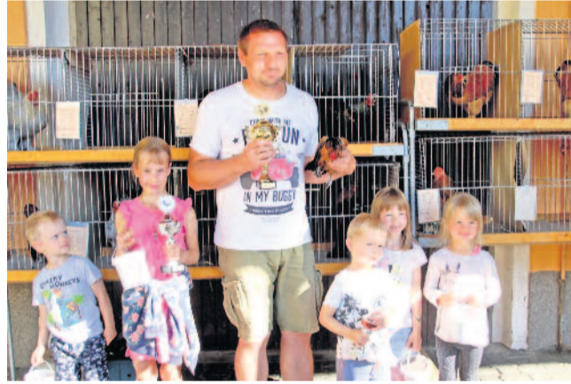
Siegerehrung des Hähnekrähens

Traditionell fand am zweiten Septemberwochenende das Röderfest in Wallroda statt. Bereits am Mittwoch haben die Kameraden der Freiwilligen Feuerwehr Wallroda und viele andere Helfer damit begonnen, das Festzelt aufzubauen und auszustatten. Bis zum Freitag mussten Theke und Bar eingerichtet und der Bierwagen sowie das Grillzelt aufgestellt werden. Mit einem Lampionumzug ums Dorf begann das Fest am Freitagabend. Allen voran der Spielmannszug Kleinröhrsdorf. DJ Ede sorgte dafür, dass bis spät in die Nacht getanzt werden konnte.