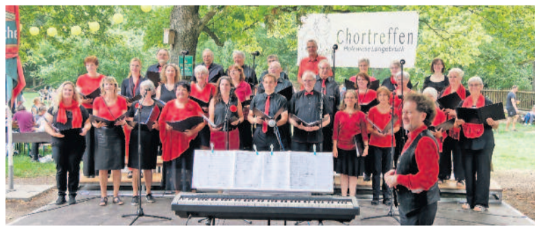
Elf regionale Chöre und ein Gastchor performten auf der Bühne.

alle Brunnlein fließen“ über belarussische Volkslieder bis hin zu „Hit the Road Jack“ und Michael Jacksons „Billie Jean“. Grandios. Langer Applaus war der verdiente Lohn. Wiederholung ausdrücklich erwünscht.