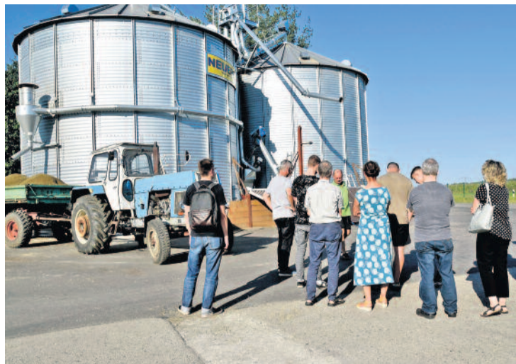
Dass zur Landwirtschaft nicht nur Tiere gehören, sondern auch sehr viel innovative Technik erfuh man bei der LWU in Großermannsdorf.

Die Sonne strahlte, die Laune war bestens und alle Teilnehmerinnen und Teilnehmer der 4. Radeberger Spätschicht freuten sich auf interessante Einblicke in die Unternehmen. Insgesamt wurden drei Touren angeboten. Unsere Redaktion schloss sich Tour 2 an, welche die LWU in Großermannsdorf, die Firma FSD im Gewerbegebiet Süd und das Karosseriewerk im Süden Radebergs besuchte.