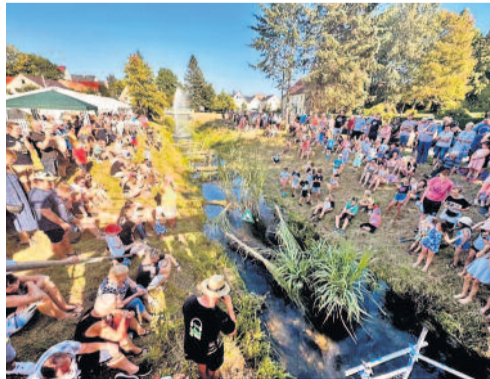
Trubel beim Entenschwimmen (Maik Wittke)

Bei bestem Sommerwetter begannen am Sonnabendnachmittag die sportlichen Wettbewerbe für Kinder. Tauziehen und Sackhüpfen begeisterten die Kinder. Für die Sieger gab es etwas aus der „Zauberbox“. Die Tanzmäuse aus Arnsdorf zeigten ihr Können. Am Abend gab es Livemusik von der Band „Schmerzfrei“ aus Dresden. Diese wurden auch an diesem Abend von der Disco unterstützt. Sonntag 08.00 Uhr, „Wecken im Dorf“. Mit lautstarker Hupe holte ein Traktor die Nachtschwärmer aus den Betten. Auf dem Hof der Familie Trepte begann das 25. Hähne-Wettkrähen. Traditionell, bereits zum fünfzehnten Mal, fand der sonntägliche Gottesdienst im Festzelt statt. Mittagessen aus der Gulaschkanone, Gebratenes vom Grill, Fischbrötchen und Kuchen gab es zu essen. Die Kinder konnten mit dem Kremser Rundfahrten machen. Der Schützenkönig von 2022 wurde mit der Kutsche abgeholt. Er eröffnete nach einer kleinen Rundfahrt das Vogelschießen 2023. In einer Pause fand das traditionelle Entenschwimmen mit mehreren Hindernissen auf der Röder statt. Weiter ging es mit dem