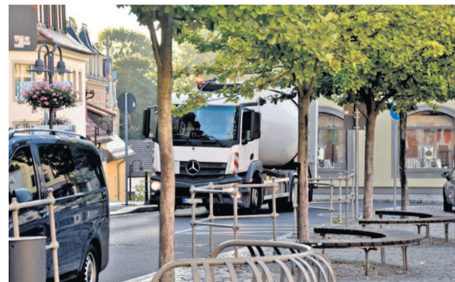
Nicht nur die Entsorgungsunternehmen sind aufgerufen, auf das ordnungsgemäße Abstellen der Tonnen zu achten. Radeberger Bürgerinnen und Bürger sind ebenfalls gebeten, die Wege freizuhalten bzw. Rücksicht zu nehmen.

Mülltonnen, die zur Entleerung bereitgestellt werden, dürfen Fußgängern und Fahrzeugen nicht das Vorbeikommen erschweren. Besonders für Personen, die auf einen Rollstuhl angewiesen sind, können Mülltonnen ein unüberwindbares Hindernis darstellen. Übrig bleibt den Betroffenen dann als einziger Ausweg nur das riskante Ausweichen auf die Straße. Die Mülltonnen passend zurechtrücken können Rollstuhlfahrer in der Regel nicht.