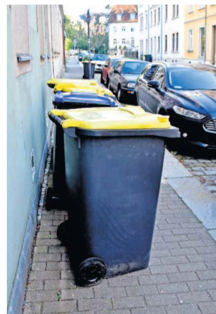
In der engen Radeberger Innenstadt ist es mitunter schwierig, die Tonnen so zu platzieren, dass der Gehweg uneingeschränkt genutzt werden kann. Es sollte vor allem darauf geachtet werden, dass die Tonnen nicht direkt an Verkehrsschildern abgestellt werden, da sonst der Pfosten zusätzlich den Weg einengt.