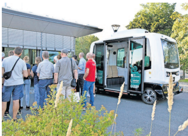
Mit Zukunftsvisionen und modernster Technik konnte FSD Fahrzeugsysteme sowohl die jüngeren aber auch die älteren Teilnehmer und Teilnehmerinnen begeistern. Ganz ohne einen Fahrer fuhr z.B. dieser autonome Kleinbus die Besucherinnen und Besucher über das Firmengelände.