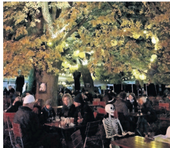
Viel gab es zu entdecken.