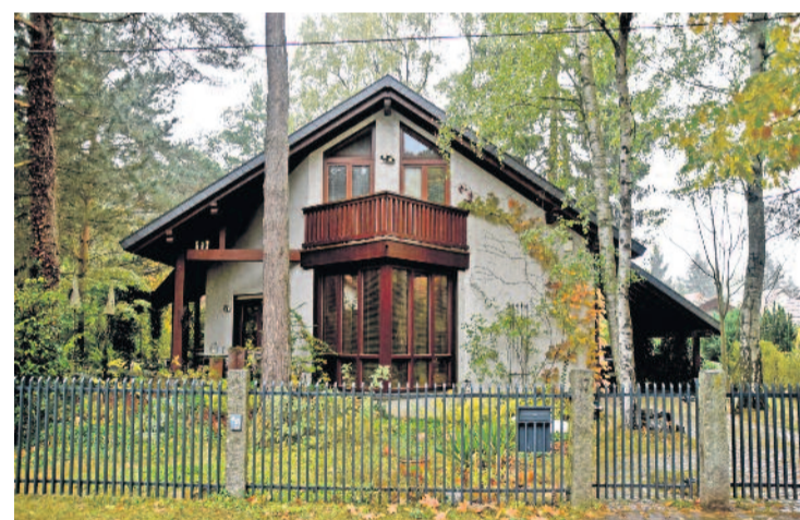
Diese Wohnbebauung steht stellvertretend für den Ortscharakter einer „Waldgemeinde“. Alle Grundstückseigentümer sind mit der Veröffentlichung der Fotos einverstanden.

widmet“, ergänzt er und zeigt uns bei einer Begehung mit seinem Stellvertreter, Roland Rammer, einige Grundstücke, die dem typischen Siedlungscharakter entsprechen. Am 25.10.2023 beschloss nun jüngst der Stadtrat den Bebauungsplan, welcher die Rahmenbedingungen erläutert und begründet.