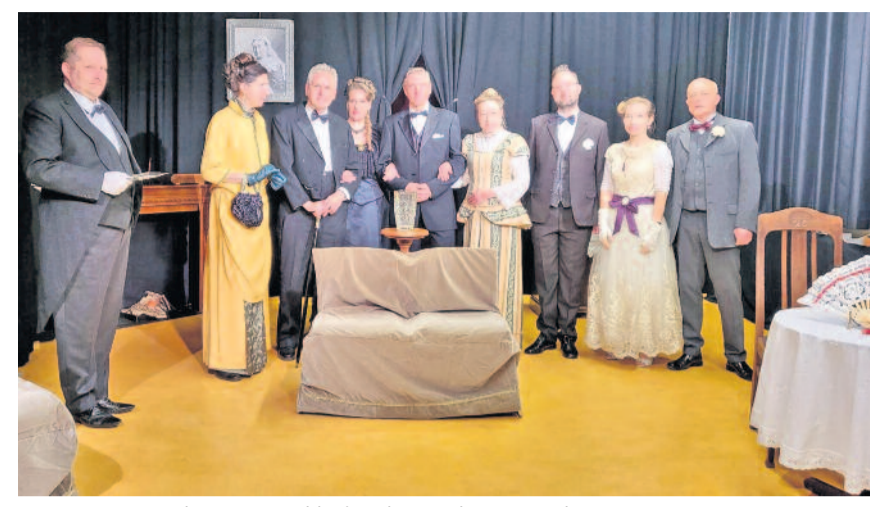
Das Theaterensemble des Kleinen Theaters Berlin Mitte präsentierte am 22.10.2023 das Stück „Der Fächer“ im Dorfgemeinschaftshaus Fischbach.

Text & Fotos Kino Arnsdorf: Red. Foto Theater: Kleines Theater Berlin-Mitte