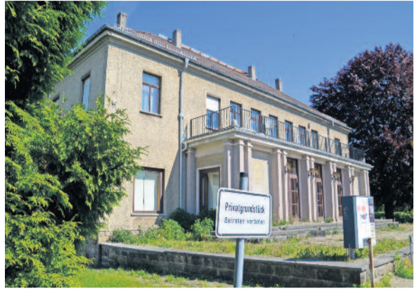
Lange wurde um den Fortbestand des alten Arnsdorfer Kinos gerungen. Im Frühjahr 2022 wurde das Gebäude, welches das Bild des Marktplatzes im Ort maßgeblich prägte, abgerissen.

Der Abriss des Arnsdorfer Kinos sorgte nicht nur für das Verschwinden eines prägenden Bildes in der Dorfmitte, sondern auch für den Verlust einer Kulturstätte. Alle Chancen, je wieder ein Filmtheater oder ähnliches in dem Gebäude einzurichten, fielen im Frühjahr 2022 der Abrissbirne zum Opfer.