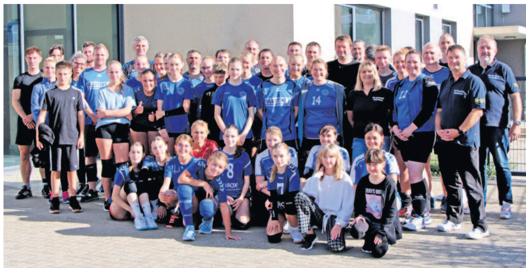
Vereinsmitglieder und Angehörige in freudiger Erwartung auf den Turnierbeginn

Am 21.10.2023 feierte unser Verein sein 20-jähriges Jubiläum in der Sporthalle der Grundschule Ullersdorf. In Form eines Mixed-Turniers wurde natürlich hauptsächlich Volleyball gespielt. Dabei wurden 8 Mannschaften aus unseren Abteilungen SCEU-Damen, SCEU-Herren und SCEU-Jugend gebildet und durch volleyballspielende Angehörige ergänzt.