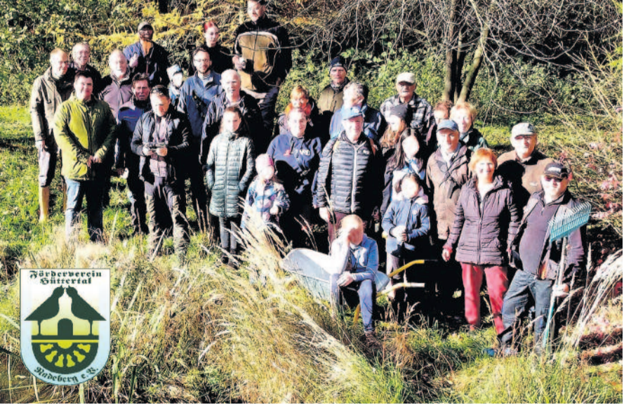
Einige der Teilnehmerinnen und Teilnehmer des Herbststeinsets im Hüttertal.

Bei schönstem Herbstwetter folgten am vergangenen Samstag, dem 04. November 2023, erneut wieder viele Bürger und Bürgerinnen, Vertreter von Institutionen, Mitglieder des Fördervereins Hüttertal Radeberg e. V. und der Abt. Bogenschützen des RSV dem Aufruf unseres Vereins zur bereits traditionellen Pflege- und Reinigungsaktion des schönen „Naturparks“ Hüttertal mit der Hütttermühle am Rande der Stadt Radeberg.