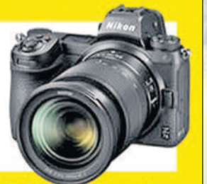
Foto Wolf | Bautzner Landstraße 11b | 01324 Dresden Tel.: 0351/2682124 | www.foto-wolf-dresden.de