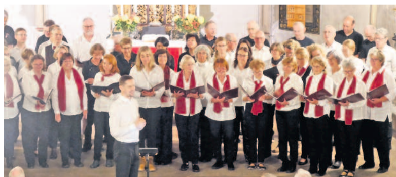
Vor Kurzem waren beide Ensembles als Musikbotschafter unterwegs, hier in Dohna. Am 9. Dezember steht das eigene Konzert an.

Für die Sängerinnen und Sänger der beiden Langebrücker Ensembles, dem Nicodé-Chor und Nicodé Pop Vocals, wird es eine ereignisreiche Woche werden. Zwei Auftritte in der Ortschaft Langebrück stehen an. Einmal sind sie Mitgestalter, genauer beim Langebrücker Weihnachtsmarkt, der am Sonnabend, 02. Dezember, seine Tore um 10.00 Uhr öffnet. Am frühen Abend folgt dann das kleine Konzert, der Nicodé-Chor und die Nicodé Pop Vocals präsentieren ab 17.45 Uhr weihnachtliche Weisen vorm Bürgerhaus. Das andere Mal sind sie selbst Gastgeber. Und zwar in der nächsten Woche, genauer am Sonnabend, 09. Dezember, im Bürgerhaus. Das Konzert beginnt an diesem Tag um 15.00 Uhr, der Einlass ist ab 14.30 Uhr. Wie immer ist der Eintritt frei. Neben klassischen und