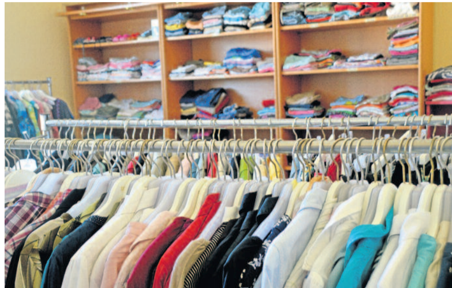
Das Team der Kleiderkammer Radeberg begrüßt Sie immer donnerstags und freitags zu den genannten Öffnungszeiten in den Räumen auf der Dr.-Rudolf-Friedrichs-Straße 24.

In einem separaten Raum, eine Etage über der Kleiderkammer, hat das Team des Sozialkaufhauses zusätzliche Lagermöglichkeiten bekommen. Hier finden Interessierte u. a. Kinderbettchen, Matratzen und diese Kinderwagen.