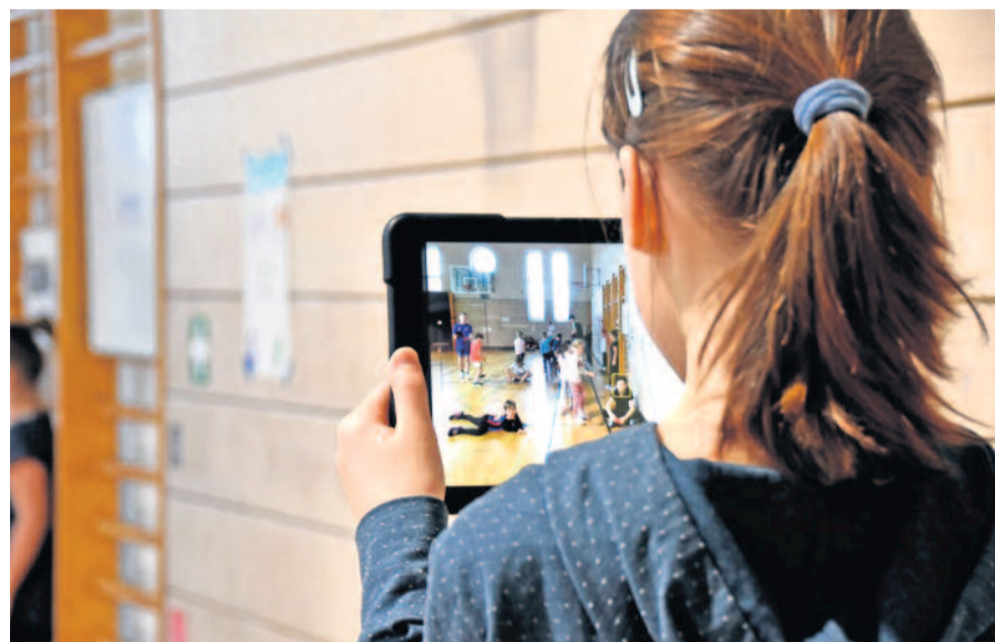
Die Mädchen und Jungen der Klasse 6L2 des Humboldt-Gymnasiums übernahmen die Durchführung des sportlichen Vormittages und dokumentierten die Leistungen der Kindergartenkinder.

Die Kooperation zwischen dem Radeberger Kinderland und dem Gymnasium besteht bereits seit einiger Zeit und bringt sowohl für die jüngeren als auch für die älteren Teilnehmer viele Vorteile mit sich. Die Gymnasiasten können in die Rolle des Lehrers schlüpfen und Verantwortung übernehmen, während die Kindergartenkinder lernen, anderen Persönlichkeiten zu folgen und zuzuhören.