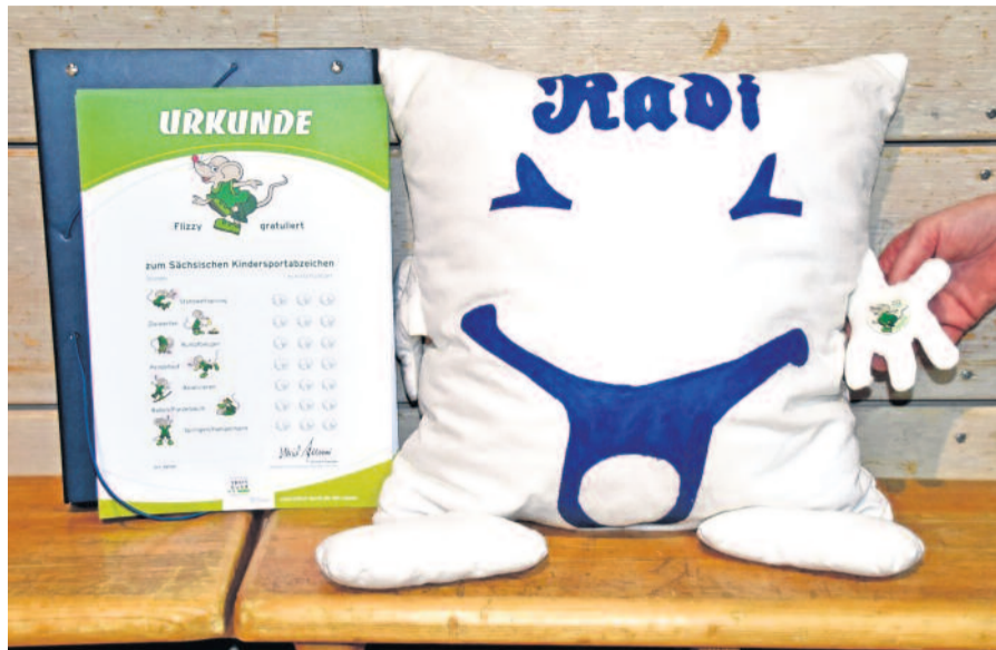
Radi darf natürlich bei diesem Vorschulabenteuer nicht fehlen. Seine Vorschulkinder absolvierten am Mittwoch, dem 28.02.2024 das Kindersportabzeichen des Landessportbundes Sachsen.

Die Vorschulkinder des Radeberger Kinderlandes hatten kürzlich die Gelegenheit, ihre sportlichen Fähigkeiten unter Beweis zu stellen. In der Turnhalle des Humboldt-Gymnasiums auf dem Freudenberg absolvierten die Mädchen und Jungen das Sportabzeichen „Flizzi“ des Landessportbundes Sachsen. Unterstützt wurden sie dabei von den Schülerinnen und Schülern der Klasse 6L2. Die Sechstklässler übernahmen die Organisation, Leitung und Durchführung des sportlichen Vormittages.