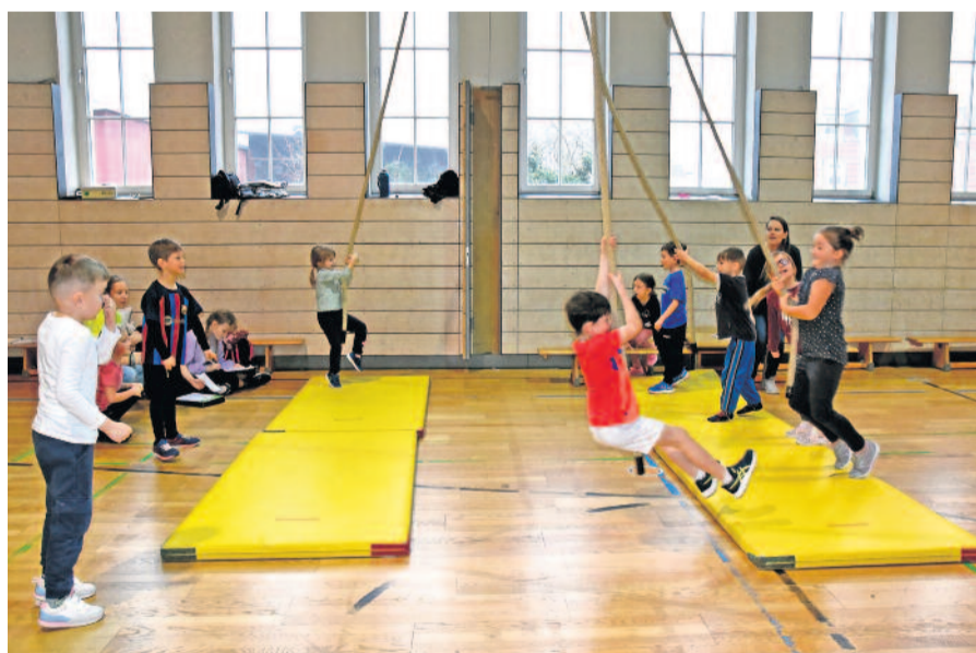
Neben der sportlichen Herausforderung darf natürlich auch der Spaß nicht fehlen. Zu Beginn und am Ende hatten die Kids Zeit gemeinsam Spiele zu spielen oder am Seil von einer Matte zur anderen zu schwingen.

Die Kooperation zwischen dem Radeberger Kinderland und dem Gymnasium besteht bereits seit einiger Zeit und bringt sowohl für die jüngeren als auch für die älteren Teilnehmer viele Vorteile mit sich. Die Gymnasiasten können in die Rolle des Lehrers schlüpfen und Verantwortung übernehmen, während die Kindergartenkinder lernen, anderen Persönlichkeiten zu folgen und zuzuhören.