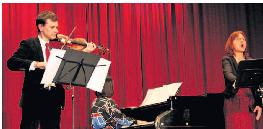
Für die Musik zeichnete sich der Freie Musikverein „Paukenschlag“ verantwortlich.