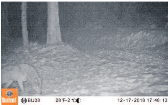
Nachweis eines Wolfes im Osterzgebirge im Dezember 2018.

Nach Auswertung der Daten des Sächsischen Wildmonitorings wurde jetzt bekannt, dass am 17.12.2018 ein Wolf nahe Rechenberg-Bienenmühle im Landkreis Mittelsachsen im Grenzbereich zum Landkreis Sächsische Schweiz-Osterzgebirge von einer automatisch auslösenden Kamera (Fotofalle) fotografiert wurde. Das Foto wurde als eindeutiger Nachweis (C1) eingestuft. Im Osterzgebirge gab es in den letzten beiden Jahren vereinzelte unbestätigte Wolfsnachweise, sowie einzelne Nachweise mittels Fotofallenbildern, die aus dem April 2017 (das Kontaktbüro berichtete), Februar 2018 und April 2018 stammten. Seit Dezember 2018 gibt es bisher keinen weiteren Nachweis aus diesem Gebiet. Noch ist unklar, ob sich das Tier dort dauerhaft niederlassen wird oder das Gebiet nur durchwandert hat. Weitere Informationen aus dem Gebiet sind notwendig.