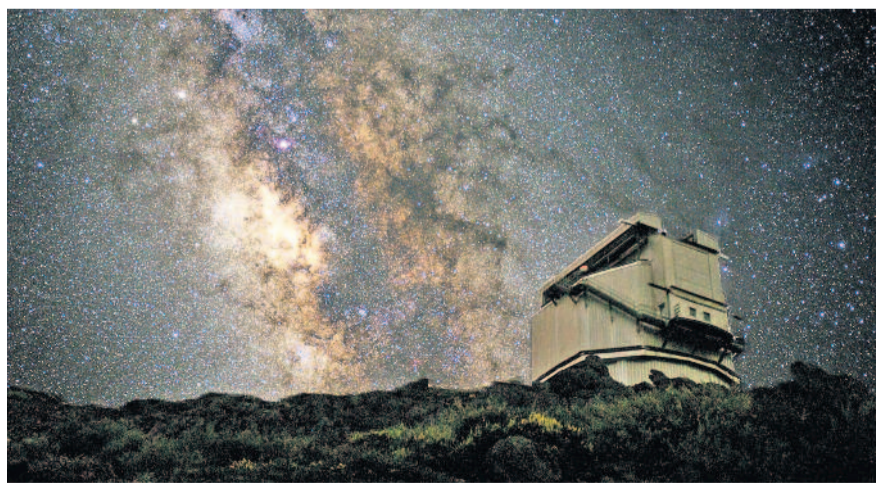
Milchstraße - LaPalma (Freundeskreis Sternwarte e.V.)

www.sternwarte-radeberg.de , info@sternwarte-radeberg.de Zum Tag der offenen Tür laden wir interessierte Gäste zur Besichtigung der Sternwarte und zu einem kleinen Vortragsprogramm ein. Durch unsere Fernrohre kann am Tag die Sonne und am Abend der aktuelle Sternhimmel beobachtet werden.