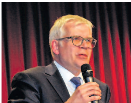
Der Bürgermeister für Bildung und Jugend, Detlef Vorjohann, überbrachte Grüße.

haus über das Kinderbetreuungshaus in der Friedrich-Wolf-Straße, wo in dieser Woche endlich der Baustart erfolgt, bis zum Bau einer Zweifeldturnhalle. Zudem die Sanierung der Hauptstraße, die sich weiter verzögert. Wie Hartmann betont, geht es nach der Planung, die bis Sommer erfolgen soll, ins sogenannte Planfeststellungsverfahren. Zwei weitere Jahre werden mindestens ins Land ziehen. Eher unbefriedigend.