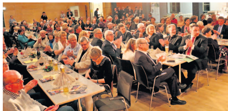
Zahlreiche Gäste waren der Einladung gefolgt.