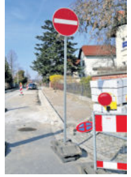
Aktuell läuft die Sanierung auf der Jakob-Weinheimer-Straße.