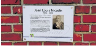
Die Gedenktafel am Grundstück Nicodestraße 11 erinnert an den berühmten Komponisten und zugleich an den Namensgeber des Langebrücker Chores.

Zum Frühlingskonzert lädt der Nicodéchor Langebrück für Sonnabend, den 13. April, in das Bürgerhaus Langebrück ein. Der Nachmittag wird nicht alleine bestritten, sondern als Gäste werden die Chormitglieder des Heidenauer Singekreises erwartet. Die Veranstaltung beginnt um 16 Uhr, der Eintritt ist frei. Im Zuge der kürzlich durchgeführten Jahreshauptversammlung wurde angeregt, in diesem Jahr den 4. Oktober zu gestalten. Bekanntlich ist der Namensgeber des Chores, Jean Louis Nicodé, am 4. Oktober 1919 verstorben. Damit führt sein Todestag zum 100. Mal. Hierzu sind die Mitglieder nun bei der Ideenfindung, wie dieser Gedenktag gestaltet werden könnte.