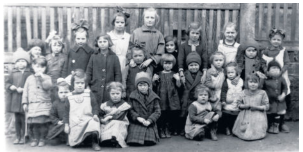
Die Mädchen der Stolpener Straße / Grundstraße / Kleinwolmsdorfer Straße.