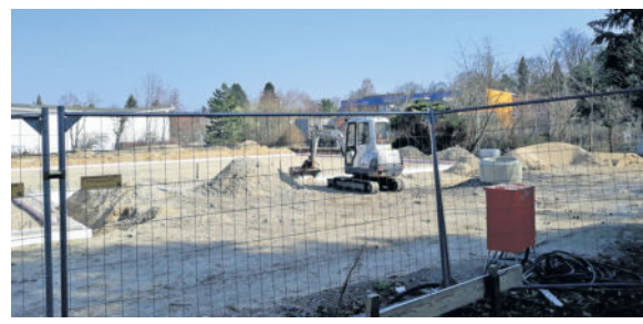
Am Kinderzentrum haben Tiefbauarbeiten begonnen.