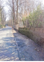
Der rechte Randstreifen der Radeberger Straße ist ausgefahren.

Die erfolgte Sanierung des Fußwegs zwischen Beethoven- und Weißiger Straße im vergangenen Jahr führte unter anderem zu einem höheren Bord. Erfreulich ist die Sanierung auf der einen Seite, doch auf der anderen hat das Ganze auch einen negativen Nebeneffekt. Vor allem der unbefestigte Randstreifen auf der rechten Seite wird immer mehr in Anspruch genommen. Die Folge: ein ausgefahrener Randstreifen mit teilweise tiefen Schlaglöchern. Hier muss unbedingt etwas passieren, denn damit ist der Weg besonders für die Heimbewohner in den nahen Wald praktisch unpassierbar.