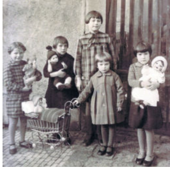
Mit dem Puppenwagen unterwegs.

verbunden und schenkte Frau Schmutzer das Foto. Einige Namen waren ihr noch bekannt, doch die Erinnerung verblasst ein wenig. Man schaut trotzdem gern auf die sepiafarbene Fotografie und lässt sich gedanklich in vergangene Zeiten Radebergs ziehen. Text: Red.; Quelle & Fotos: Frau Schmutzer