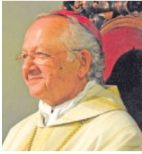
Bischof Joachim Reinelt, Bistum Dresden-Meißen

Die Redaktion „Radeberger Heimatzeitung“ hofft, Sie mit diesem kurzen Einblick neugierig auf den umfangreicheren Artikel zu Bischof Joachim Reinelt gemacht zu haben?