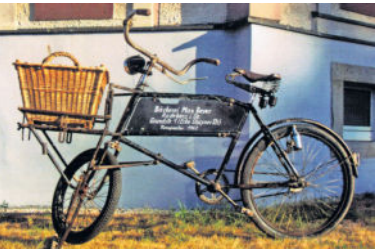
Traditionelles Fahrrad zum Ausfahren der Backwaren.