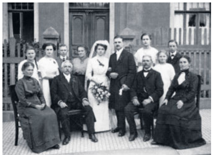
Familienfoto vom 26.07.1913 vor dem Haus Grundstraße 1.