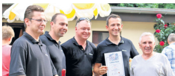
Die Carnevalisten holten 2018 den 2. Platz, sie wollen 2019 den KTVL vom Thron stoßen.