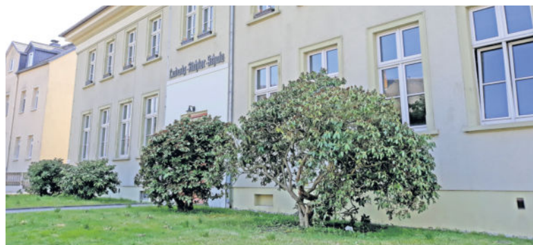
Die Ludwig-Richter-Schule in Lotzdorf bleibt im kommenden Schuljahr 2019/2020 für Langebrücker Fünftklässler offenbar verschlossen. Aufgrund der hohen Anmeldezahlen in Radeberg werden sie nicht aufgenommen.

schen Staatsministerium für Kultus, dem Landkreis Bautzen sowie den Schulträger werden bereits geführt. Nur so viel ließ Jens Drummer durchblicken: „Gespräche mit Eltern laufen hier teilweise schon. Die genauen Zahlen erhalten wir zum Stichtag der Erstellung der Aufnahmebescheide im Mai“. In dieser Woche soll es einen Elternabend in Lotzdorf geben.