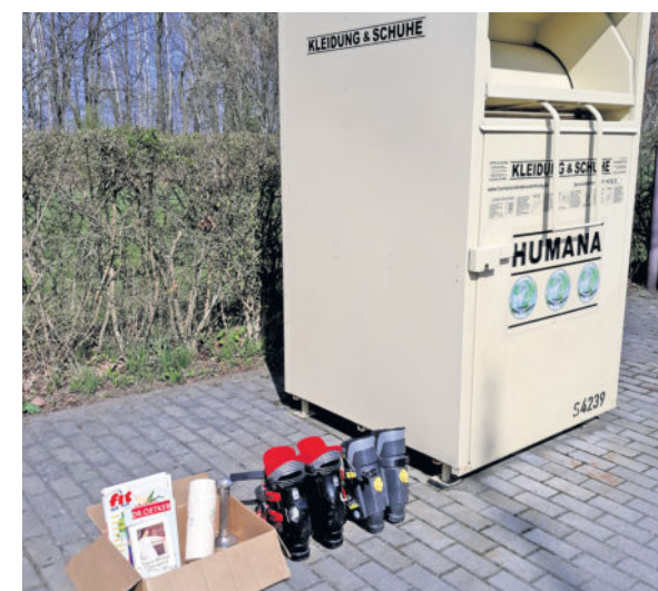
Auch in der vergangenen Woche wurde am Containerplatz an der Neuulzheimer Straße im neuen Heidehof wieder illegaler Müll entsorgt.