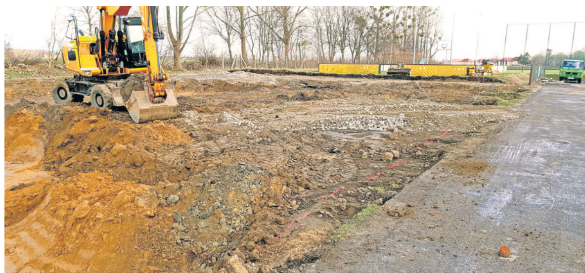
Am 25. März 2019 fiel offiziell der Startschuss für das Projekt „Ersatzneubau Turnhalle Arnsdorf“