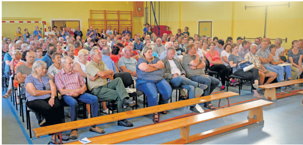
Rund 200 Interessierte nahmen am Montag an der Informationsveranstaltung zur Gemeindefusion in der Turnhalle Lichtenberg teil.

Kann die Zukunft gemeinsam gestaltet werden?