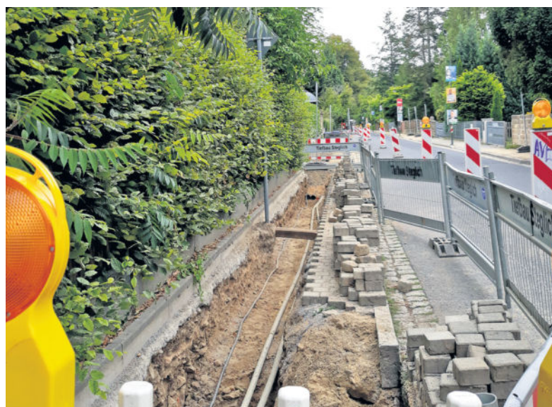
Bauarbeiten auf dem Gehweg in der Beethovenstraße.

Die zweite Maßnahme betrifft die Beethovenstraße, hier gibt es aktuell massive Einschränkung des Fahrverkehrs. Heißt, die Baustelle ist nur in eine Fahrtrichtung passierbar, zudem gibt es hier aktuell keinen starken Durchgangsverkehr. Straßenschilder kündigten seit Anfang August an, dass auf der Beethovenstraße gebaut wird. Nun ist es so weit. Träger der Baumaßnahmen ist die DREWAG. Es werden verschiedene Leitungssysteme überprüft, eventuell entflochten oder ersetzt. Geplant wird mit der Verlegung und der Erneuerung von Leitungen im Fußweg, danach schließen sich Kanalisationsarbeiten an. Die Anwohner wurden bereits über die Einschränkungen informiert. Das Bauende ist für Ende September (39. Kalenderwoche) vorgesehen. syg/geb