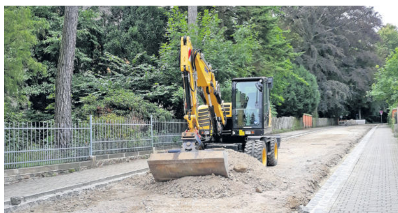
Auf dem hinteren Teil der Moritzstraße wird derzeit zwischen Blumenstraße und Steinweg die Fahrbahn erneuert.