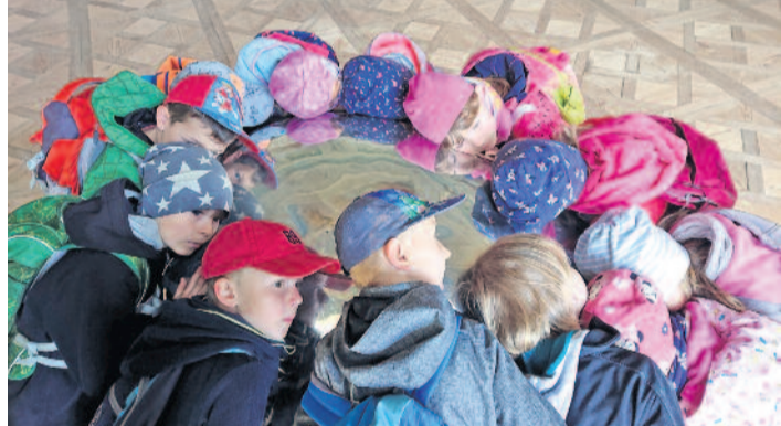
Kinder am Klangobjekt „Ursprung“ im „Raum des Lebens“.

Am Sonntag lädt der Kunst- und Kulturverein ORLA e.V. und der Kirchbauverein wieder zusammen nach Wachau ein. Für alle, die den Raum- und Klanginstallationen im Barockschloss noch nicht lauschen konnten, ist an diesem Sonntag, dem 29. September, um 16.00 Uhr, die allerletzte Gelegenheit, denn am Montag beginnt der Künstler Andreas Hetfeld den Rückbau der Ausstellung und überführt die Werke wieder in die Niederlande.