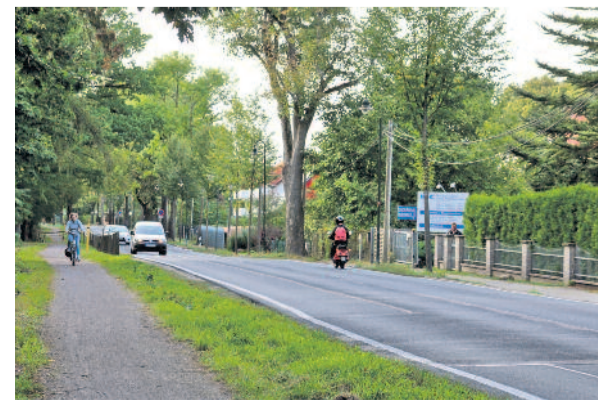
Eine Verkehrszählung ergab, täglich fahren hier zwischen 8.500 und 9.000 Fahrzeuge und 800 Radfahrer.

Um auf die Aktion aufmerksam zu machen, führen sie gemeinsam mit weiteren Langebrückern mit dem Fahrrad von Langebrück nach Klotzsche. Veranstalter war die Arbeitsgemeinschaft „nachhaltig mobil im Dresdner Norden“.