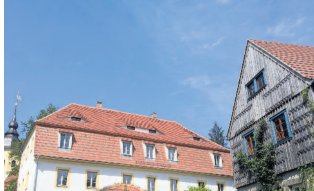
Kirche und ehemaliger Pfarrhof als Sitz des ORLA e.V. in Wachau

Für den in Wachau begonnenen Impuls, der mit der barocken Pfarrhaussanierung 2017 und dem Kulturprojekt „Echtzeitkultur“ 2018 gestartet ist und in Zusammenarbeit mit dem Kirchbauverein den schönen Ortskern Wachaus zwischen Schloss und Kirche vielseitig belebt, hat der ORLA e.V. am 21. September 2019 unter 202 Teilnehmern einen Anerkennungspreis der Wüstenrot Stiftung in Höhe von 1.500 EURO in Erfurt erhalten. Dem Preis wird 2020 noch eine Ausstellung folgen. Wir sind gespannt und freuen uns, dass aus der Ausstellung heraus an diesem Wochenende jetzt auch ein Begegnungsnest am Rand des Seifersdorfer Tals mit Eltern der Kita Himmelsleiter, den Mitgliedern des ORLA e.V., begeisterten Anwohnern und Lesern des Radeberger Anzeigers entstehen wird. Wer sich beteiligen möchte, schreibe gern an post@orkultur.de. Der ORLA e.V. wird am Montag von einer weiteren Kulturjury des Bundes (TRAF0 4.0) konsultiert werden. Hier geht es um ein Zukunftsprojekt unter dem Titel VIA CULTURA 4.0, das für den gesamten Kulturraum zwischen Kamenz, Pulsnitz und Löbau förderlich wäre und weitere Vereine und Museen bei ihrer Arbeit unterstützen könnte. Eine Entscheidung wird im Dezember erwartet.