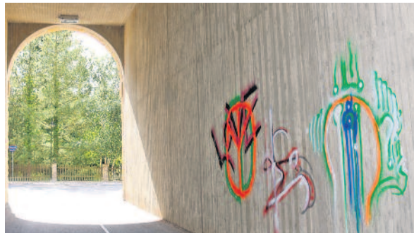
Nicht zum ersten Mal haben Unbekannte das Viadukt mit Graffiti verunstaltet. Die jüngste Aktion entstand in der Nacht vom 11. zum 12. September.