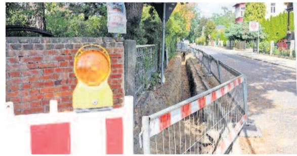
Sichtbar gehen die Bauarbeiten in der Bergerstraße voran. Laut Information der „Langebrücker Nachrichten“ werden diese voraussichtlich bis zum 25. Oktober andauern.