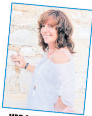
MDR Sachsen TOP10