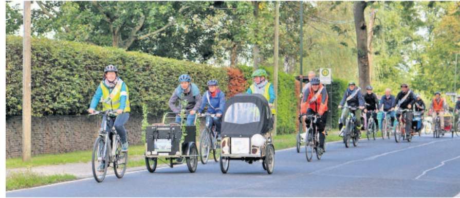
Von Langebrück ging es gemeinsam per Rad nach Klotzsche.