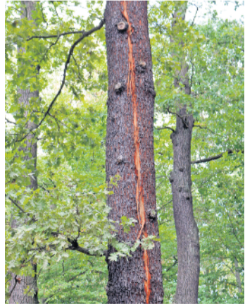
An der Weißiger Straße stehen die „Sieben Eichen“. An einem Baum sind die Spuren eines Blitzeinschlages deutlich zu sehen. Am späten Abend des 31. August schlug er ein.