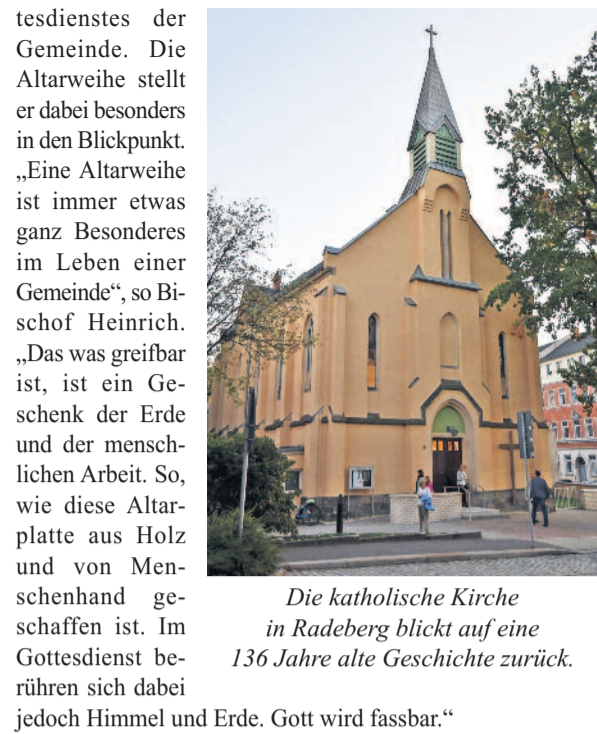
Die katholische Kirche in Radeberg blickt auf eine 136 Jahre alte Geschichte zurück.