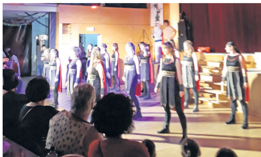
Die Funkgarde begeistert mit ihren Tänzen.

Zu der gekonnten Eigenleistung, sprich einem Programm, das mit dem vorhandenen Personal des Vereins gestaltet wurde, kamen zwei Elemente, die völlig neu waren. Emotionaler Höhepunkt jener Passage im Programm, bei der drei Generationen von Karnevalisten mit ihrem Nachwuchs zu sehen und zu erleben waren. Zugleich auch ein gelungenes Dankeschön an Ehepartner und Freunde, an Kinder und Enkel, die in der Zeit der Vorbereitung und der Veranstaltungen viel an familiären Erlebnissen jenseits von Karneval entbehren müssen. Denn nahezu ungezählt sind jene Stunden, die in der Ausgestaltung des Bürgerhauses für die Veranstaltungen stecken. Auf jeden Fall nehmen die Gäste von LATOLLKA mit, es wird auch künftig die Faschingsidee in Langebrück leben. Zum Fasching für Junggebliebene gab es auch ein zweites Element, eine etwas andere Einstimmung als bisher