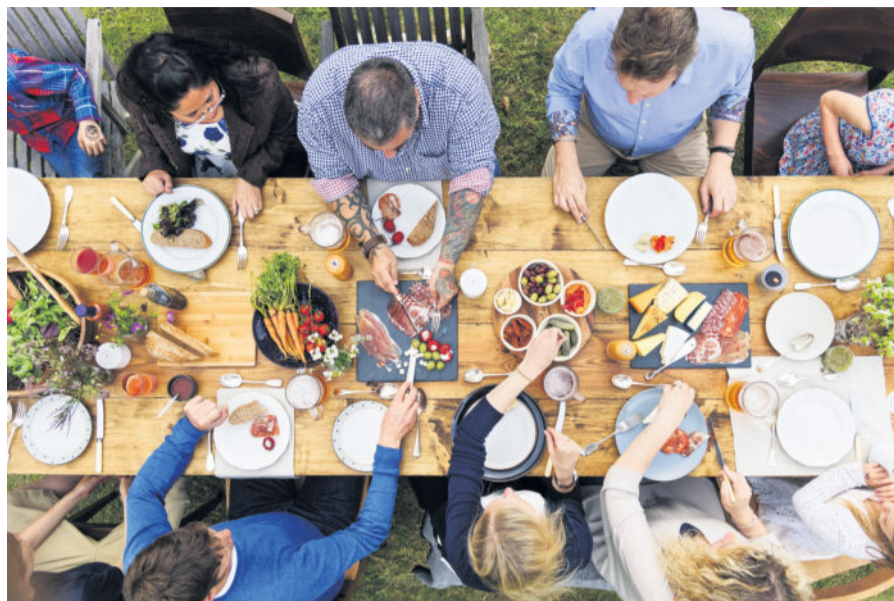
Alle an einem Tisch und doch mit unterschiedlichen Ansichten in Sachen Ernährung.