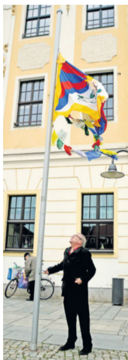
Text & Fotos: Red.

Die Kriege der Vergangenheit sollten eigentlich Lehre genug sein, solche Konflikte nicht mehr entstehen zu lassen. Dennoch rüsten einige Nationen weiter fleißig auf und die Waffenexporte steigen stetig an. Somit ist auch der kleinste Farblecks am Himmel ein Zeichen für den Frieden und ein respektvolles, friedliches Miteinander.