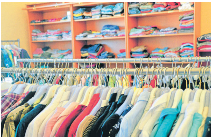
Demnächst hängt hier die Kleidung für die wärmeren Jahreszeiten auf den Bügeln, dann sind die Regale für die Sommersaison ausgestattet.