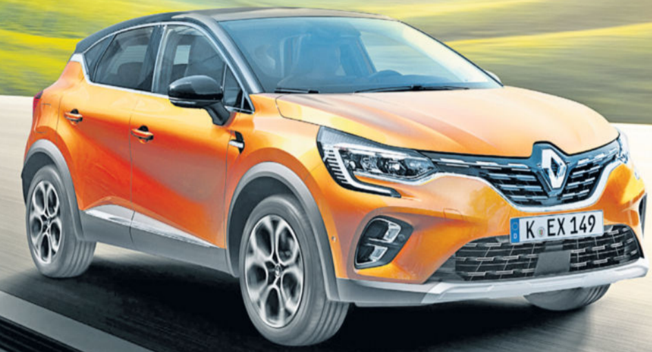
Renault Captur LIFE Tce 100 ab

Jetzt bis zu 11.500 € Neu-für-Alt-Prämie* sichern: gültig für viele Renault Modelle.