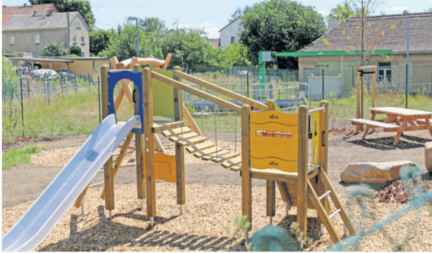
Der neue Spielplatz scheint fertig, doch es muss nachgebessert werden.

waren bereits die Hecke und weitere Sträucher gepflanzt, weitere Begrünung folgte. Investiert werden ungefähr 50.000 Euro. Vor Ort gibt es Kleinspielgeräte, ein Sandkasten und eine Sitzgruppe.