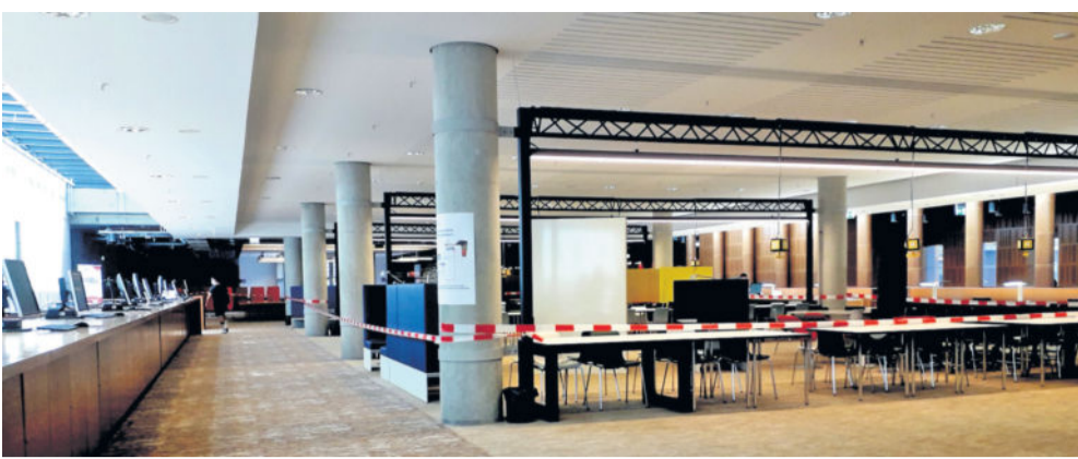
Der obere SLUB-Lesesaal in Corona-Zeiten...