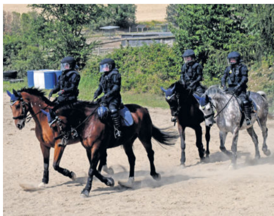
Präsentation der Reiterstaffel mit Schutzausstattung für spezielle Einsätze.

Bitte beachten: E-Mails ohne eindeutigen Betreff und Absender werden aus Sicherheitsgründen sofort gelöscht!