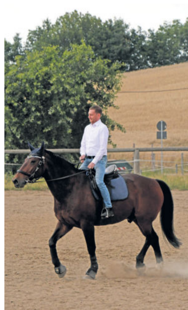
Sachsens Ministerpräsident wagt selbst einen Ritt auf einem der gut ausgebildeten Polizeipferde.