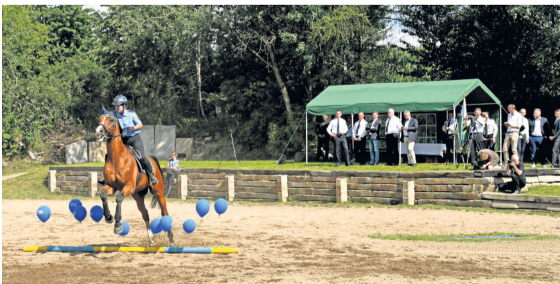
Was die Polizeireiterstaffel alles kann, zeigten die Beamtinnen und Beamten während einer kleinen Präsentation auf der Anlage.

„Ob bei Großveranstaltungen, im Streifendienst oder bei der Suche vermisster Personen, die Polizeireiterstaffel ist eine der vielseitigsten Einheiten der Polizei Sachsen. Mit den Beamtinnen und Beamten spreche ich über die Besonderheiten bei ihren Einsätzen, außerdem ging es um den Planungsstand zur Neuunterbringung auf dem Polizeireal auf der Stauffenbergallee in Dresden“, so Sachsens Ministerpräsident Michael Kretschmer nach seinem Besuch bei der Reiterstaffel der sächsischen Polizei im Radeberger Ortsteil Groß-