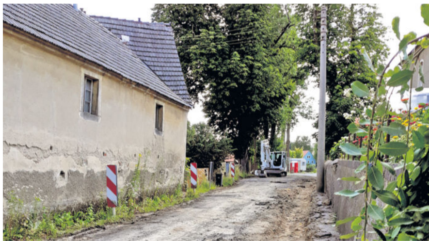
Gebaut wird in der Hauptstraße zwischen den Hausnummern 50 a und 63.

Die Arbeiten führt die Firma HEF Flotmann Tiefbau GmbH & Co. KG durch. Die Kosten betragen rund 21.500 Euro, heißt es dazu abschließend.