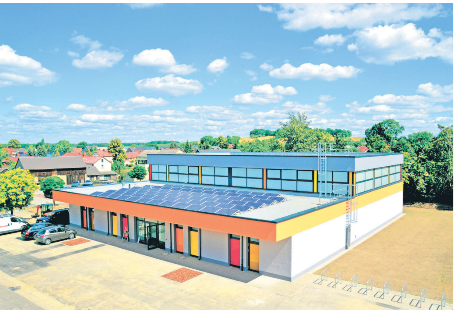
Schlicht und modern aber trotzdem farbig abgesetzt präsentiert sich die neue Turnhalle in Arnsdorf. Wichtiger Punkt in Sachen Energie, ist die Photovoltaik-Anlage auf dem Dach.

Von der Stolpener Straße aus ist sie kaum zu sehen, doch wer hinter die alte Plattenbauschule blickt, kann sich den strahlenden, modernen Turnhallenneubau genau anschauen. Wir durften bereits einen Blick hinein werfen und erleben ausgeklügelte Raumsysteme, nachhaltige Baustoffe, innovative Technik und barrierefreie Räumlichkeiten. Sport frei! Die Einfeld-Sporthalle mit einem geräumigen Sozialtrakt, welcher über eine Behindertentoilette, Damen- und Herrentoiletten sowie Duschen, Umkleidekabinen, Lehrer- bzw. Trainerräume und Kammern für Reinigungsutensilien verfügt, hat rund 3 Millionen Euro gekostet. Gefördert wurde das Bauprojekt durch den Förderpotf SchulInfra (Förderrichtlinie des Sächs. Staatsministeriums für Kultus zur weiteren Verbesserung der schulischen Infrastruktur im Freistaat Sachsen), der Bauablauf gestaltete sich problemlos. Aktuell werden noch wenige Restarbeiten am Gebäude erledigt und die Bauabnahmen der einzelnen Gewerke finden statt.