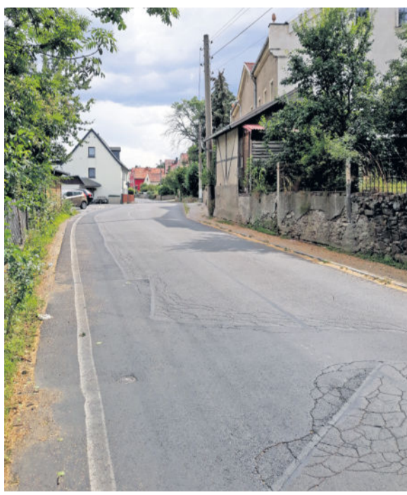
Die Hauptstraße ist in einem schlechten Zustand. Seit 17 Jahren ist das Thema präsent.

Seit 2003 fordert und befördert der Ortschaftsrat den grundhaften Ausbau von Klotzcher Straße und Hauptstraße in der Ortschaft Langebrück. Seitdem folgte eine Vielzahl von Studien, Überlegungen und Vorplanungen, die auch wiederholt im Ortschaftsrat beraten wurden. Dabei ging es immer wieder um Ausführungsvarianten, Eigentums- und Finanzierungsfragen. Begleitet wurde dieser Prozess von unzähligen Gesprächen mit der Stadtverwaltung, wechselnden Bürgermeistern, Oberbürgermeistern und Stadträten sowie Beschlüssen des Ortschaftsrates. Auch der Stadtrat der Landeshauptstadt Dresden hat in den vergangenen Jahren zwei Beschlüsse zur Umsetzung durch die Dresdner Stadtverwaltung gefasst. Demnach sollte seit nunmehr acht Jahren der schrittweise Ausbau erfolgen. Planungsmittel wurden in den Haushalt eingestellt. Seit vergangem Jahr sollte nun die Vorplanung abgeschlossen, in den Gremien beraten und die Fortführung der Planung mit dem Ziel der baulichen Umsetzung ab 2022 beschlossen und beauftragt sein. Seitdem mahnt der Ortschaftsrat immer wieder die Umsetzung dieser Zielsetzung an. Trotz mehrerer Beschlüsse des Ortschaftsrates hat sich