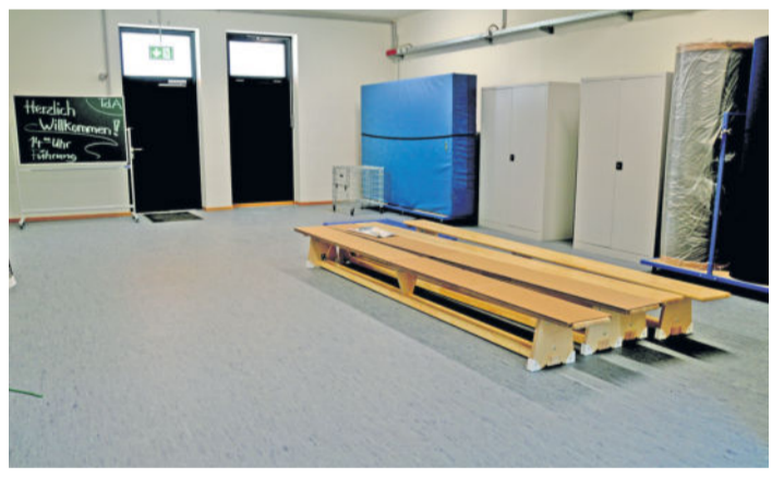
Im Geräteraum werden noch Markierungen am Boden geklebt, damit immer alles an derselben Stelle zu finden ist.

um einen Turnhallenneubau, damals noch mit Multifunktionsgebäude. 2016 sahen die Ideen noch etwas anders aus, orientierten sich allerdings auch schon an einem etwaigen Oberschulstandort bzw. der Nutzung der Plattenbauschule. Eine offizielle Eröffnung der neuen Sport- und Kulturstätte wird es voraussichtlich am 04.09.2020 für geladene Gäste geben. Dem folgt für alle Interessierten ein Tag der offenen Tür für Jedermann am 05.09.2020.