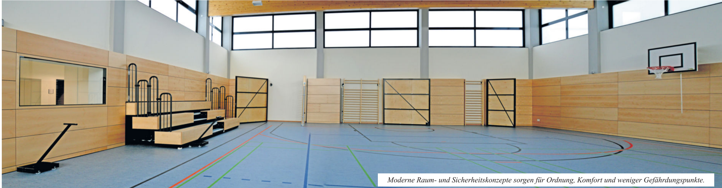
Moderne Raum- und Sicherheitskonzepte sorgen für Ordnung, Komfort und weniger Gefährdungspunkte.