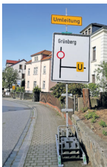
Die Umleitung nach Grünberg ist ausgeschildert.

Wer von der Langebrücker Straße aus über die Hauptstraße nach Grünberg fahren will, muss mit mehr Fahrzeit rechnen. Denn noch bis Freitag, 28. August, wird die Hauptstraße zwischen den Hausnummern 50 a und 63 asphaltiert. Darüber hinaus wird in diesem Hauptstraßenabschnitt die Entwässerung teilweise erneuert. Während der Bauarbeiten ist die Fahrbahn