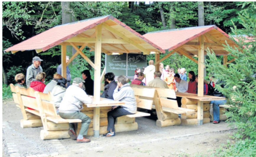
Übergabe des „Grünen Klassenzimmers“ am 06.10.2006.