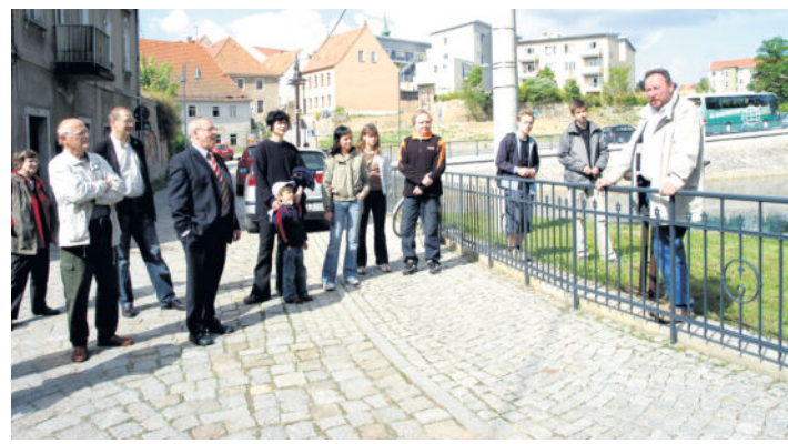
Symbolische Übergabe der Planetentafel am Schloss Klippenstein am 20.05.2006.

bewältigt, so zum Beispiel der Bau des Grünen Klassenzimmers für etwa 35 Personen, die Umsetzung eines Waldhortes für die Grundschule Stadtmitte, welcher nun seit bereits 10 Jahren in Betrieb ist, und der Aufbau des historischen Backofens. Letzterer setzt im Grundschuljahrplan der 3. Klasse ein und thematisiert die Entstehung „vom Korn zum Brot“.