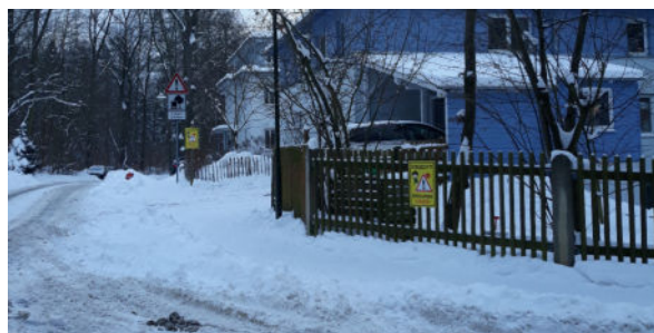
Für die Feuerwehr ist die Weißiger Straße die schnellste Verbindung zur Ullersdorfer Straße.