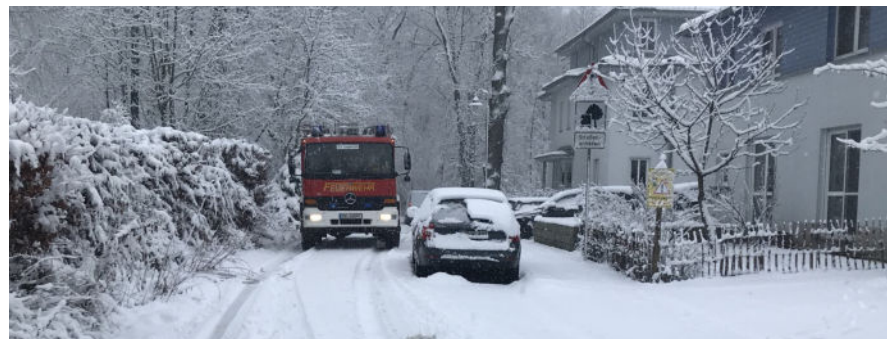
Mit dieser Situation war die Feuerwehr beispielsweise am 23. Januar dieses Jahres konfrontiert. In der Weißiger Straße ist kein Durchkommen.

„In letzter Zeit häufen sich die Meldungen, dass Rettungsfahrzeuge im Einsatz durch parkende Autos blockiert werden“, teilt Ortsvorsteher Christian Hartmann auf Anfrage mit. Bereits zum zweiten Mal in diesem Jahr standen parkende Fahrzeuge in der Weißiger Straße im Weg. Einmal am 23. Januar, dann am 5. Februar. Für die Einsatzkräfte und besonders für den Fahrer zusätzlicher Stress. Innerhalb des Bruchteils einer Sekunde muss er die Lage einschätzen und eine Entscheidung treffen: Entweder rückwärts fahren und über die Engstelle Beethovenstraße oder aber halb