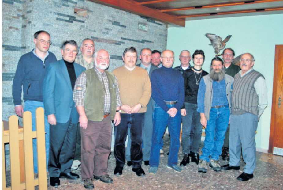
Vereinsgründung des Förderverein Hüttertal e.V. am 02.02.2006.

Der Verein verfolgt, seit der Gründung vor 15 Jahren, ausschließlich Aufgabenlösungen im Sinne der Gemeinnützigkeit, insbesondere für das Hüttertal als Naherholungsgebiet und touristische Attrak-