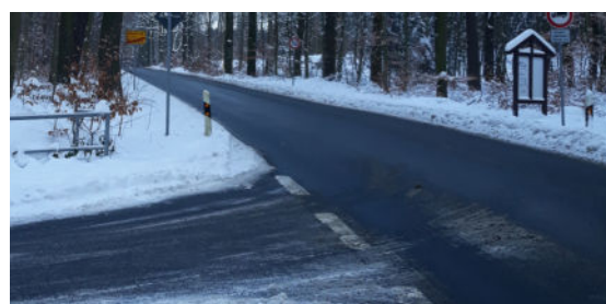
Ecke Weißiger- / Ullersdorfer-Langebrücker Straße.

Wie es seitens der Verwaltungsstelle heißt, darf auf der Weißiger Straße zwischen der Beethovenstraße und der Radeberger Straße nicht geparkt werden, denn die