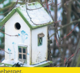
Wir sind Radeberger.