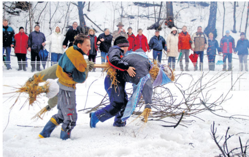
26.03.2006 - mit dem „Todaustragen“ wird ein heidnischer Frühlingsbrauch gefeiert.

Durch die jahrelange Arbeit des Vereins ist es gelungen, die gesteckten Aufgabenstellungen über das Maß zu erfüllen. So konnten wir eine Vielzahl an Maßnahmen erfüllen. Ein großes Projekt setzt sich durch Wegeinstandsetzung durch das gesamte Tal, das Aufstellen von Bänken und überdachten Sitzgruppen für Wanderer und deren jährliche Instandsetzung sowie das Erstellen und Errichten von verschiedenen Hinweistafeln zur Geschichte des Tales und seiner Flora und Fauna. Zur Orientierung sorgen wir ebenfalls für ausreichend Beschilderung. Große Projekte wurden