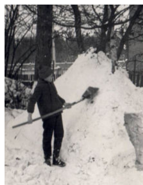
Diese Fotos zeigen den damals zwölfjährigen Langebrücker im Winter 1970.