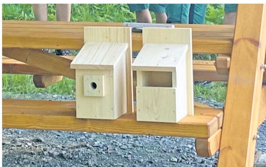
Auch solche Nistkästen sind entstanden.