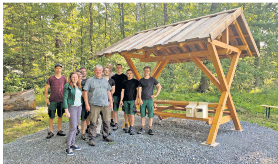
An der Wiese zur Hofewiese, genauer an der Ecke Kannenhenkel / Runde 4 gelegen, können Ausflügler eine Rast einlegen.