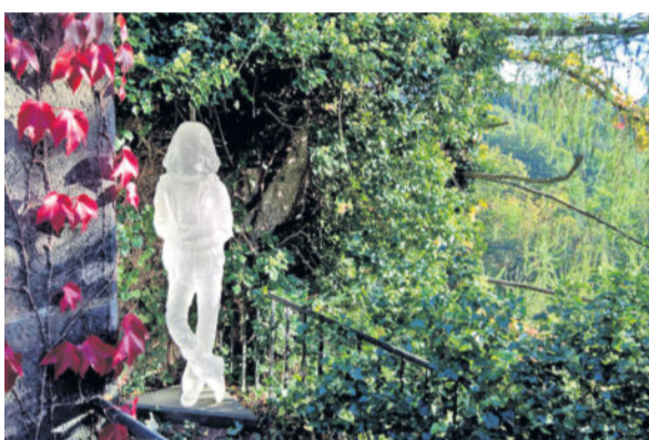
Text: Günter Kuhr (www.freizeitdresden.de)

Neben vielen anderen, schönen Zielen, hat unsere Gruppe ein interessantes Kleinod entdeckt und besucht - den Skulpturengarten auf der Sonnenleite 15 in Dresden Bühlau. Wir möchten dieses Ausflugsziel ganz besonders empfehlen. Die dort wohnende bildende Künstlerin Barbara Bauer führt gemeinsam mit ihrem Mann auf sehr unterhaltsame Weise durch die große Gartenanlage, in der sich zahlreiche Exponate bedeutender Künstler/Innen aus aller Welt befinden. Alles ist sehr beeindruckend und die freundliche und kompetente Art der Führung macht großen Spaß. Eintritt wird nicht verlangt, nach telefonischer Anmeldung kann man sich durch die Anlage führen lassen.