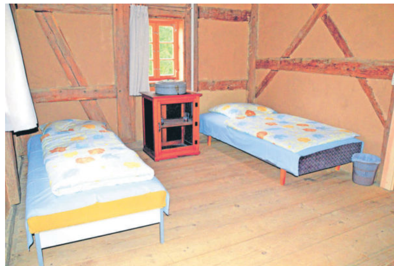
Die Schlafstätten wurden liebevoll eingerichtet.