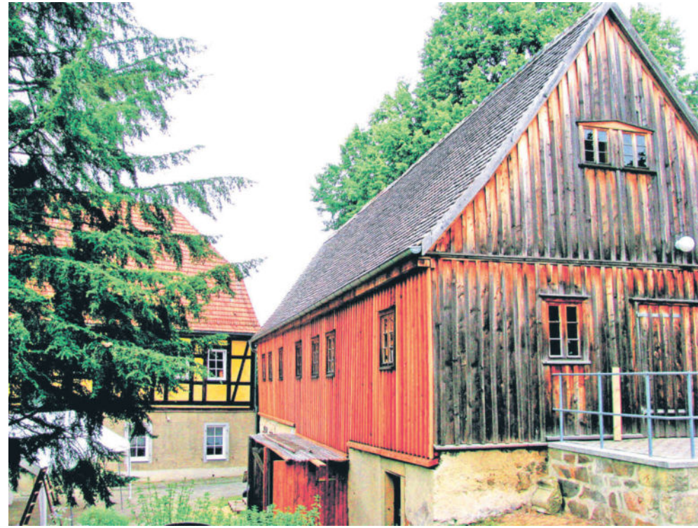
Blick in den Pfarrhof - an der hier sichtbaren Giebelseite des Pächterhauses befindet sich der Eingang zur Pilger-Unterkunft.