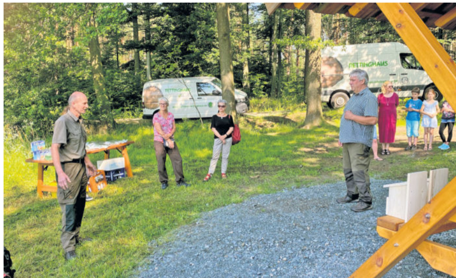
Vergangenen Freitag erfolgte die offizielle Übergabe.

Möbelmanufaktur Rettinghaus hat aus heimischen Holzsorten etwas geschaffen / Anlaufpunkt für Rastsuchende