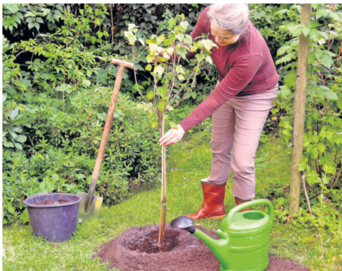
Der Herbst ist die richtige Zeit, um Bäume und Sträucher zu pflanzen, beim Anwachsen helfen Mittel zur Pflanzenstärkung.