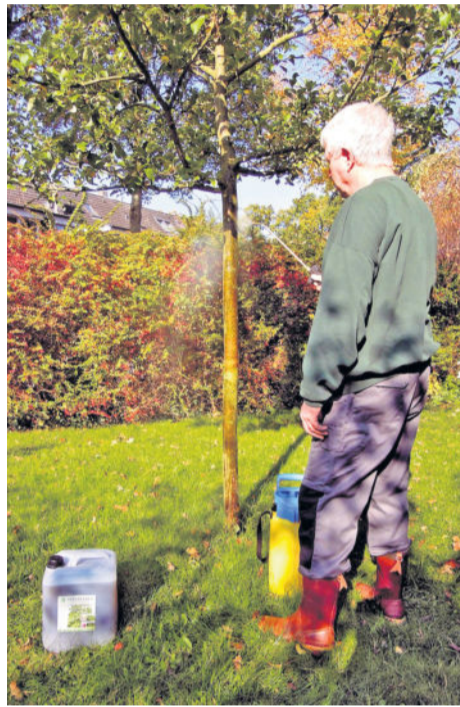
Mittel zur Pflanzenstärkung kräftigen Bäume und fördern das Bodenleben. So kommen die Pflanzen besser durch den Winter.

(djd). Kirschen im Frühsommer, Pflaumen im Hochsommer, Zwetschgen, Äpfel und Birnen im Herbst: Ein clever angelegter Obstgarten versorgt uns fast das ganze Jahr über mit frischen Vitaminen. Und er bietet den Vorteil, dass man genau weiß, wo die Früchte herkommen und dass sie rein biologisch angebaut sind. Die beste Zeit, um neue Obstbäume zu pflanzen, ist der Herbst. Die jungen Bäumchen haben dann bereits ihr Laub verloren und können ihre Energie in die Wurzelbildung am neuen Standort stecken.